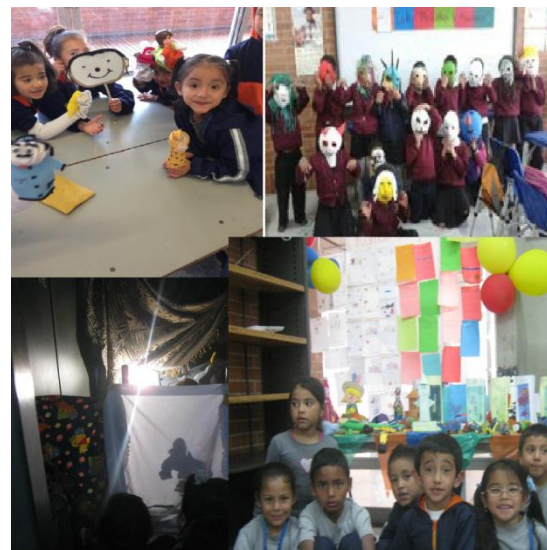
Ilustración 8, Evidencia, producto final.

- Muestra de diferentes elaboraciones de cada grupo.