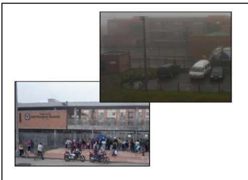
Ilustración 2, I.E.D. Nueva Esperanza y José Francisco Socarrás

Se encuentran ubicadas en las unidades de planeación zonal la Flora y Bosa Occidental, de las localidades de Usme y Bosa, respectivamente, situadas al sur de Bogotá; las cuales se ubican en los estratos socioeconómicos 1 y 2.