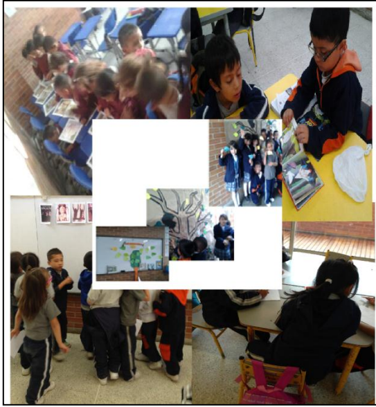
Ilustración 7, Evidencias, Fase III.