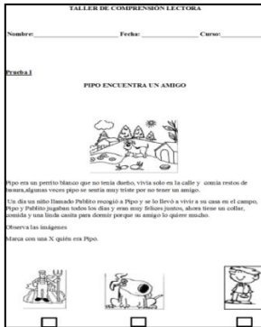
Ilustración 4, Muestra prueba diagnóstica.

Además se observa a los estudiantes a través de la prueba diagnóstica diseñada a manera de taller y la cual se subdividió en tres diferentes pruebas, que estaban dirigidas y en concordancia con el nivel académico y los procesos cognitivo de cada grupo de estudiantes; la cual se diseñó a partir de las competencias cognitivas (interpretativa, argumentativa y propositiva).