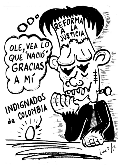
Imagen tomada de: http://luiscaricaturas.blogspot.com/2012_06_01_archive.html (Luis caricaturas de luis)

A la par, distintas organizaciones sociales como la ONG de la Coalición Ciudadana por la Justicia y grupo de "twitteros" como el movimiento de "Manos Limpias" y "Movimiento de Constituyentes Primarios" así como líderes de opinión se unieron a la causa. Dejando en evidencia su oposición e indignación colectiva a través de la plataforma virtual.