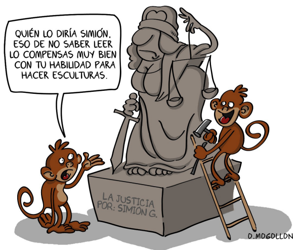
Imagen tomada de: http://www.omogollon.com/2012_06_01_archive.html (Humor gráfico e ilustrado)

El proceso de desarrollo de las redes sociales de Internet y sus cifras, son una de las pruebas de que nadie se alcanzó a imaginar el impacto que éste podría tener en nuestra sociedad. Mucho menos posible era que los gobiernos avisaran el uso que la sociedad podría darles, tampoco calcularon el poder e influencia que podrían tener las personas sobre temas políticos, económicos, culturales, sociales y hasta en los medios de comunicación, gracias a estas herramientas.