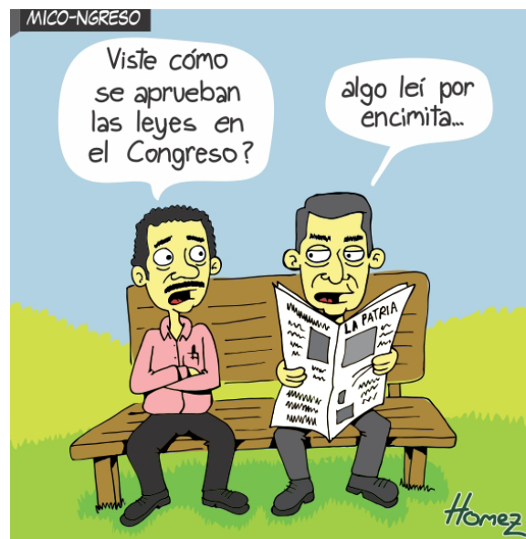
Imagen tomada de: http://caricaturahomez.blogspot.com/2012/06/la-reforma-la-justicia-en-mico-ngreso.html (Caricatura de Opinión de Homez desde Manizales, Colombia)

Estas conclusiones se matizan, teniendo en cuenta que la aparición de un medio capaz de permitir la participación dinámica de los individuos no supone la desaparición de la rutina periodística, puesto que, según palabras de Víctor Solano, "el periodismo debe seguir existiendo con los principios filosóficos y éticos entendido como una disciplina indispensable para la sociedad", de manera que no sólo será transformado a un periodismo moderno (periodismo ciudadano por ejemplo) en pro de generar mayor participación activa de los ciudadanos, sino que permitirá con ello mayor control social, entre otras consecuencias.