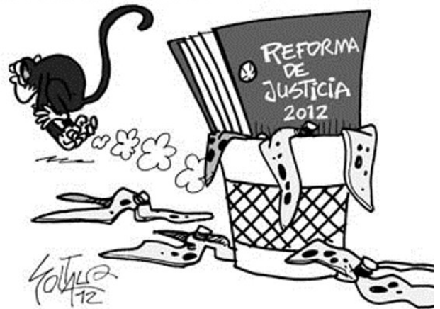
Imagen tomada de: http://www.lanacion.com.co/2012/06/29/caricatura-29-de-junio-de-2012/ (La Nación.com.co)