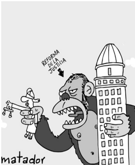
Imagen tomada de: http://darfuturo.blogspot.com/2012/06/auto-ammnistia-golpe-de-estado.html (Un Camino Hacia el Futuro)

Twitter: Es el mensaje o texto de 140 caracteres de largo que postea cada usuario en su perfil de Twitter