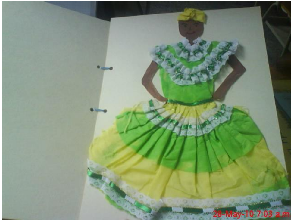
Traje del Currulao de la Región Pacífica, elaborado con papeles, cintas y demás elementos reciclables.