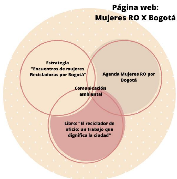
Figura 1. Infografía: componentes página web

Es importante anotar que una de las estudiantes autora de este proyecto, hizo parte del diseño e implementación de la “Estrategia de mujeres recicladoras por Bogotá” y es autora del libro “El reciclador de oficio en Bogotá: un oficio que dignifica a la ciudad”.