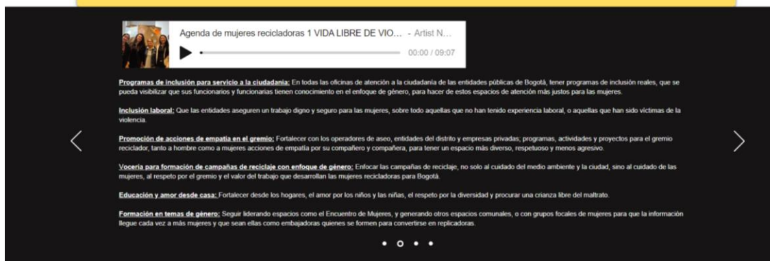
Figura 3 Audio en cada punto de la agenda