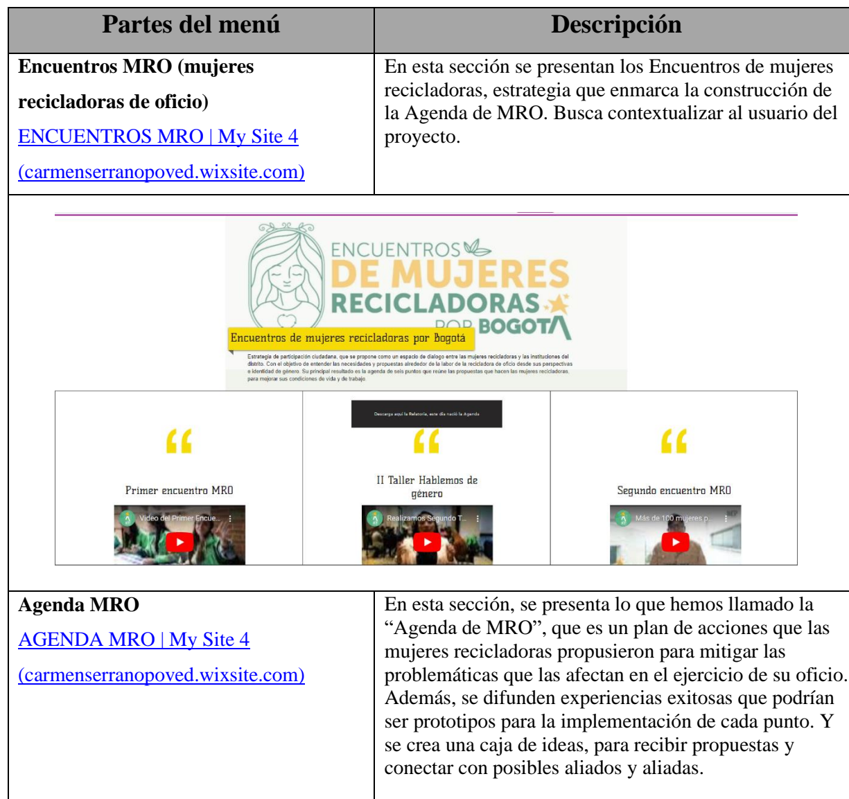
Tabla 1 Partes de la Pagina Web Mujeres RO por Bogotá. 1