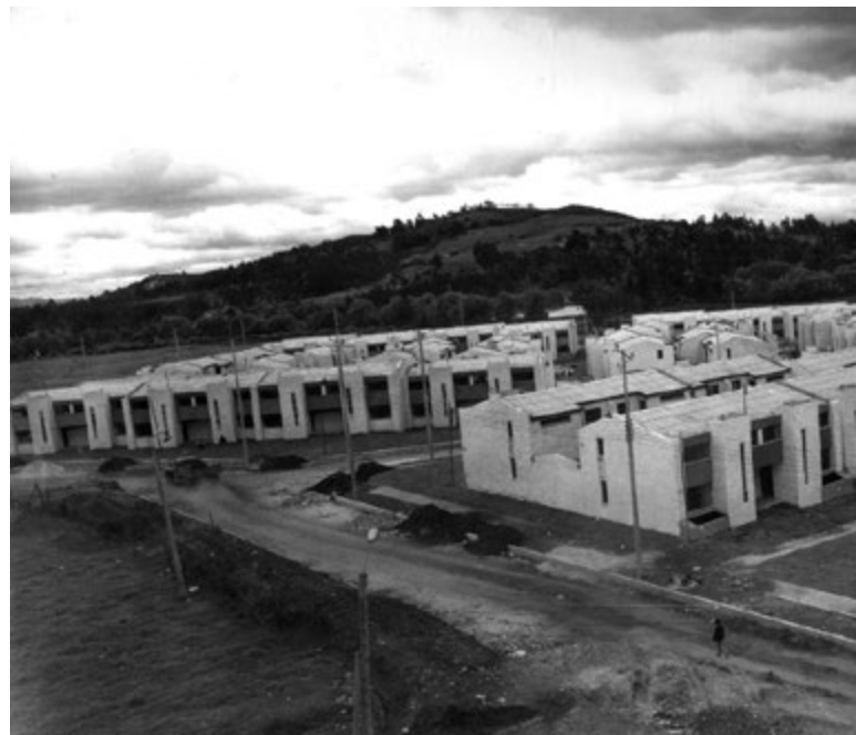
Primeras viviendas construidas del barrio Minuto de Dios en la ciudad de Bogotá

Toda la obra Minuto de Dios se ve reflejada hoy a lo largo y ancho del país: a través de la Corporación Minuto de Dios, la vivienda y la ayuda Humanitaria; la CEMID los colegios en diferentes lugares del País; la Universidad