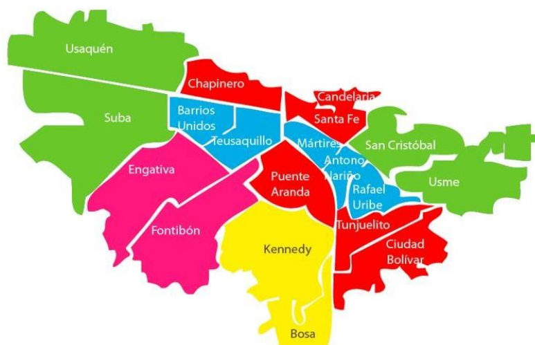
Ilustración 2 Mapa geográfico de Bogotá