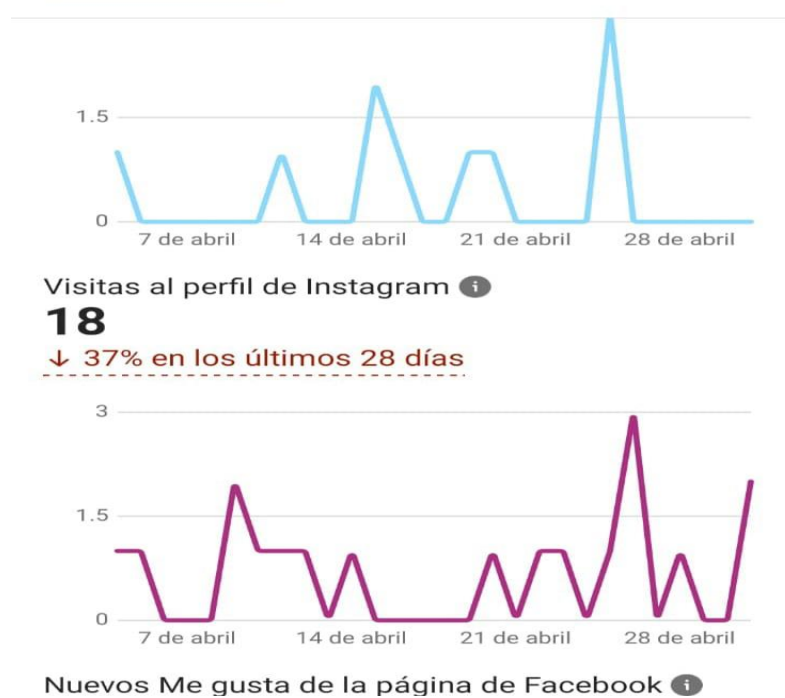
Ilustración 6 Alcance de páginas Instagram y Facebook mes de abril 2022.