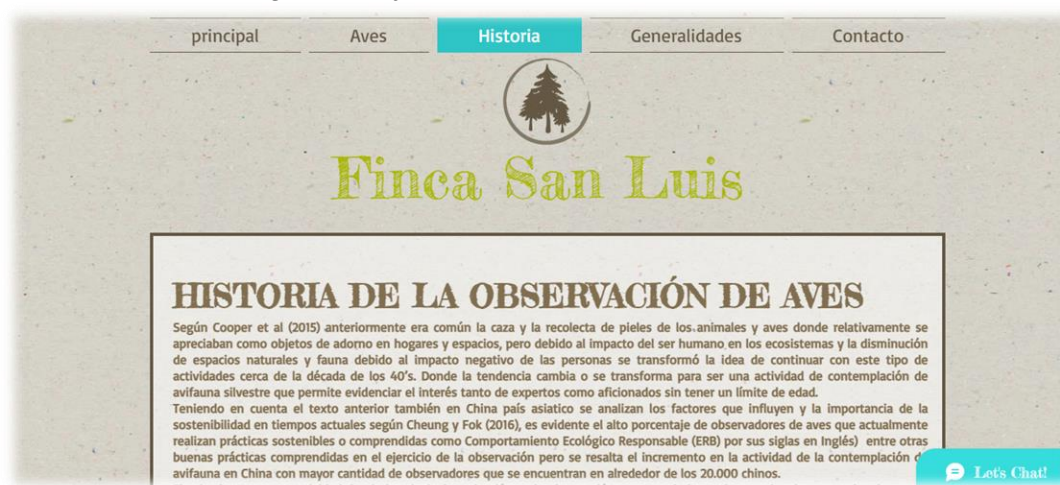
Ilustración 4 Página web finca San Luis

Prototipo página web: https://leidyarias-j.wixsite.com/my-site