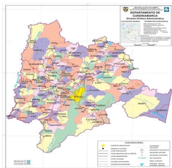
Ilustración 1 mapa departamento de Cundinamarca