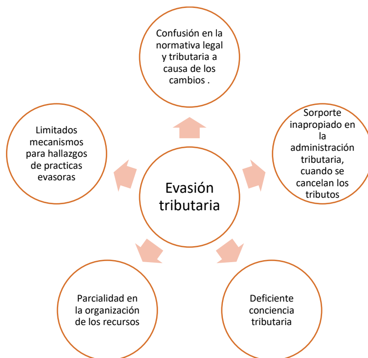
Figura 5. Causas de la evasión tributaria.

De acuerdo a figura 5. la evasión intensifica la desigualdad horizontal; las personas y empresas reciben los mismos bienes y servicios públicos, indistintamente si evaden o no. Cuando se evade, las empresas obtienen una ventaja competitiva, y las personas, un mayor ingreso disponible.