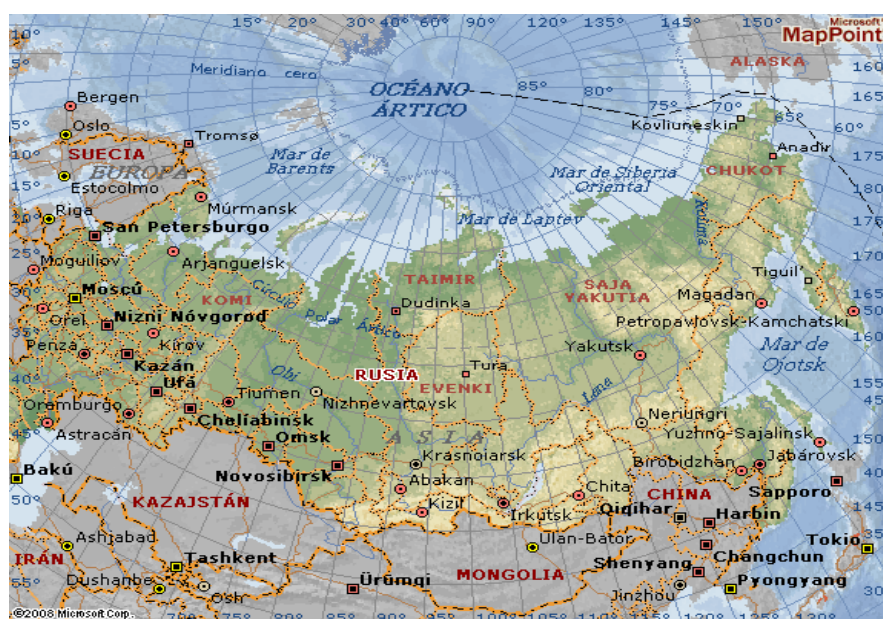
Imagen 8 Mapa Rusia

Esta república semi presidencialista formada por ochenta y cinco sujetos federales, es el noveno país con mayor población en el mundo al tener 146 804 372 habitantes. Ocupa toda el Asia del norte y alrededor del 40% de Europa y es un país transcontinental En Rusia hay once zonas horarias Rusia tiene las mayores reservas de recursos energéticos y minerales del mundo aún sin explotar, y es considerada la mayor superpotencia energética posee las mayores reservas de recursos forestales y la cuarta parte del agua dulce sin congelar del mundo.