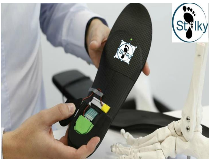
Imagen 1 Plantilla 1