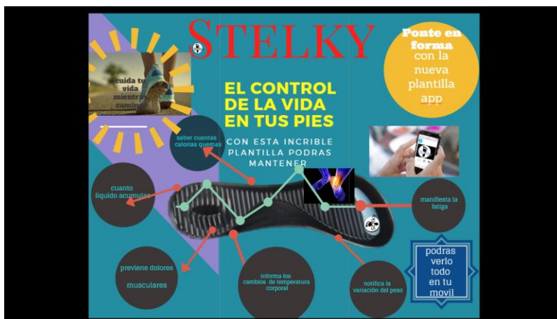
Imagen 4 Stelky