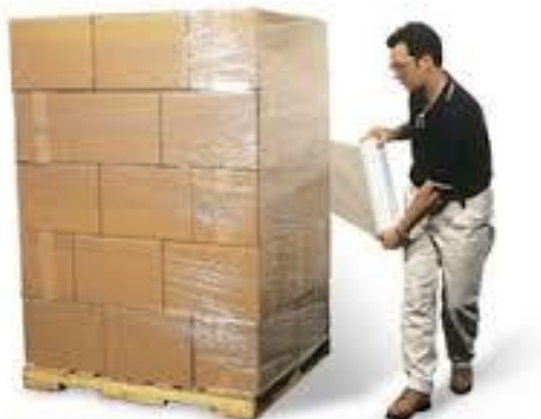
Imagen 11 Embalaje

Recipiente de carga: Se hace el transporte por medio de contenedores de 40''