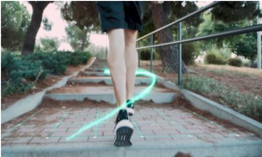
Imagen 3 Plantilla 3