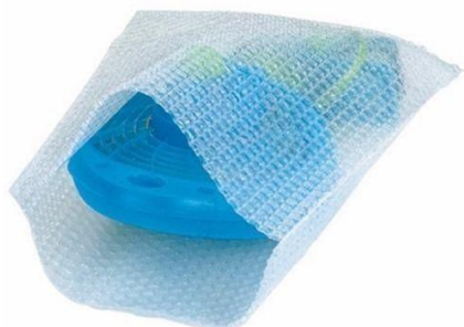
Imagen 9 Empaque interno

Empaque externo: Empaque del producto: así le llegara al consumidor final.