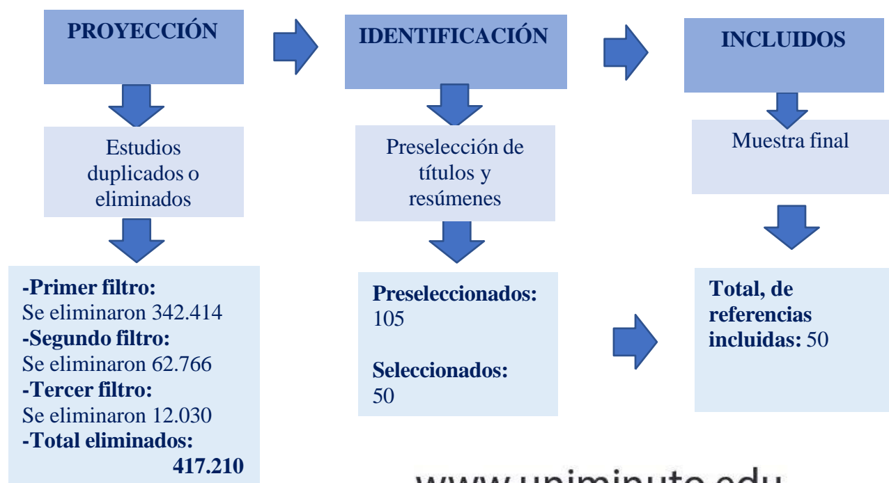
Figura 2 Flujoograma del proceso de identificación, selección/eliminación e inclusión de Revisión Sistemática