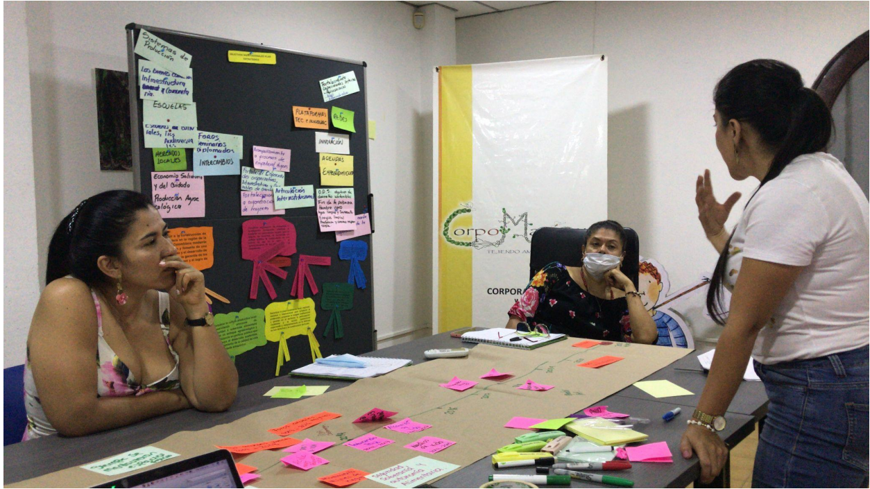
Foto: Mariana García, Construcción Línea de tiempo, 13 de marzo de 2021.

En el 2003 un grupo de caqueteños y caqueteñas fueron convocados a trabajar para la agencia de cooperación alemana Diakonie Katastrophenhilfe, quien brinda ayuda humanitaria mundial a poblaciones víctimas de desastres de origen natural o político. Esta agencia inició su trabajo en Seguridad y Soberanía Alimentaria, apoyo psicosocial y ayuda humanitaria con población víctima del conflicto armado en Florencia, Caquetá. Es allí donde luego de trabajar durante tres años en los municipios de Cartagena, La Montañita, Puerto Rico y Florencia, un grupo de 24 personas empiezan a pensarse como equipo y a soñar con una organización propia que operara los recursos de la cooperación en el departamento del Caquetá.