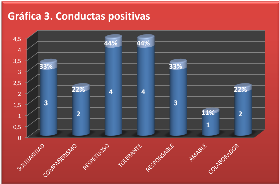
Gráfica 3. Conductas positivas

Conductas positivas identificadas en los niños del curso 501.