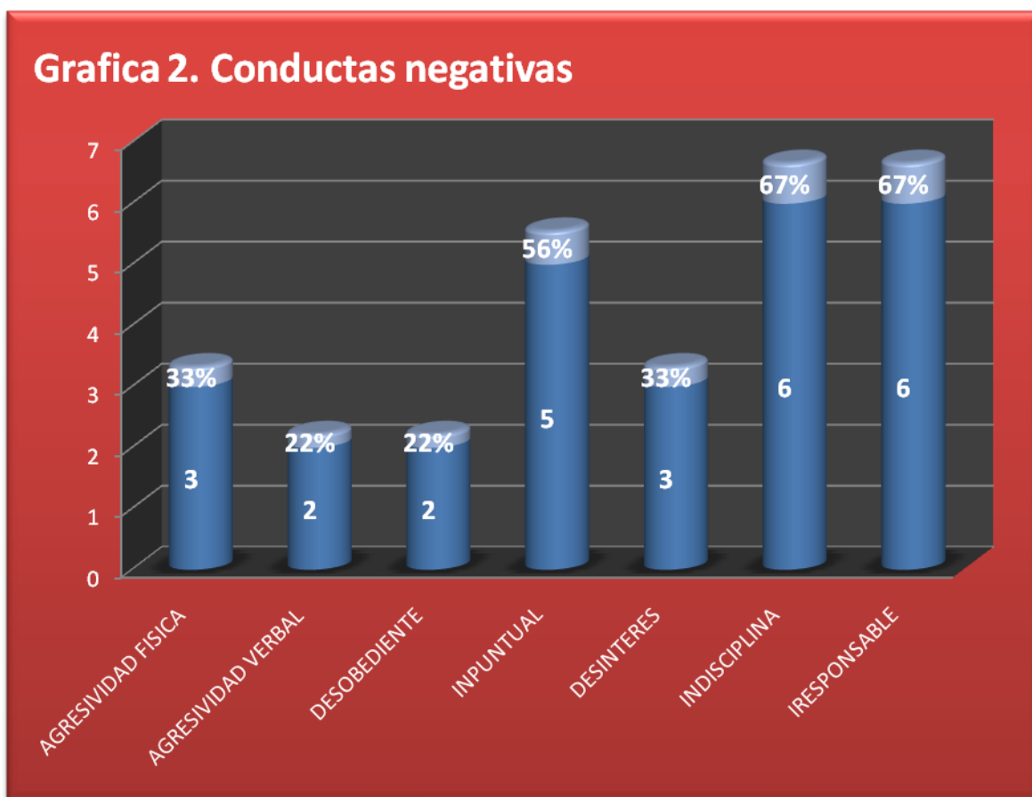
Conductas negativas identificadas en los niños del curso 501.

Estas son las conductas identificadas en 9 niños del curso 501: