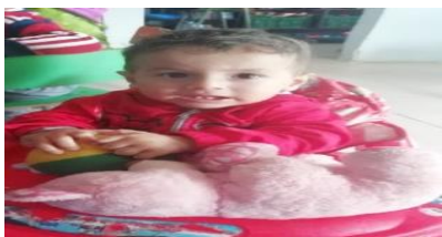
Figura 4. Menor protagonista del estudio de caso (MUÑOZ, 2019)

La UDS cuenta con una cobertura de 13 niños y niñas menores de 5 años, donde se focalizó al menor que presenta NEE, para realizar esta práctica profesional III de inclusión por medio del estudio de caso, con menor que presenta discapacidad motora.