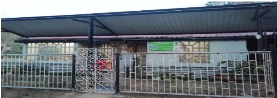
Figura 3. Fotografía UDS HCB Las Gaviotas Dos, (Acevedo, Fotografía de UDS Las Gaviotas Dos, 2019)

Esta modalidad tradicional promueve el cuidado, la protección, la salud, la nutrición y el desarrollo psicosocial se brinda a través de las madres comunitarias, o agentes educativos quienes atienden en su vivienda a trece niños y niñas en edad de primera infancia en condiciones de vulnerabilidad, promueven el ejercicio de sus derechos, con la participación activa y organizada de la familia, la comunidad y las entidades territoriales, durante 200 días al año, en jornadas de 8 horas diarias, propiciando el desarrollo integral.