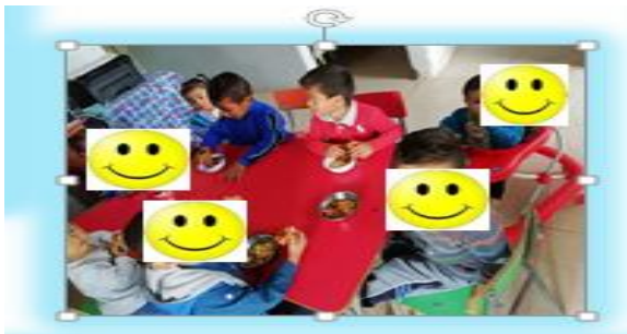
Figura 5. Fotografía de evidencia de actividad realizada el 01/10/2019 (MUÑOZ, 2019).

Al implementar la planeación anterior de observó las necesidades que se pueden presentar en un aula de clase, con respecto a la temática de alimentación saludable, en la cual los niños y niñas demuestran gusto por algunos alimentos y por otros no, el azúcar a todo niño le encanta,