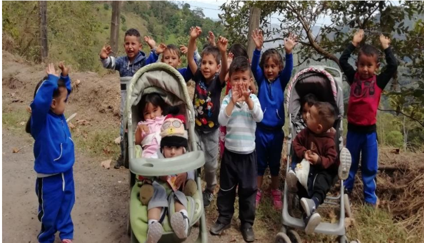
Figura 5. Fotografía del grupo de niños y niñas de la UDS y el menor protagonista del estudio de caso

Por medio de entrevista con la madre del menor comentó que el niño nace el día 26/06/2018, en el departamento de Boyacá, en la ciudad de Tunja, en el momento tiene 14 meses de edad, presenta un estado de salud de complejidad, inicialmente el infante presenta discapacidad motora de miembro inferior izquierdo, debido a que tiene diagnóstico de pie equino varo, desde el nacimiento el cual le ha impedido un sano y adecuado desarrollo.