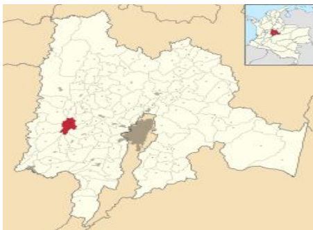
Figura 2. Mapa del Municipio de Quipile, Cundinamarca (Colombia) (Milenioscuro , 2012)