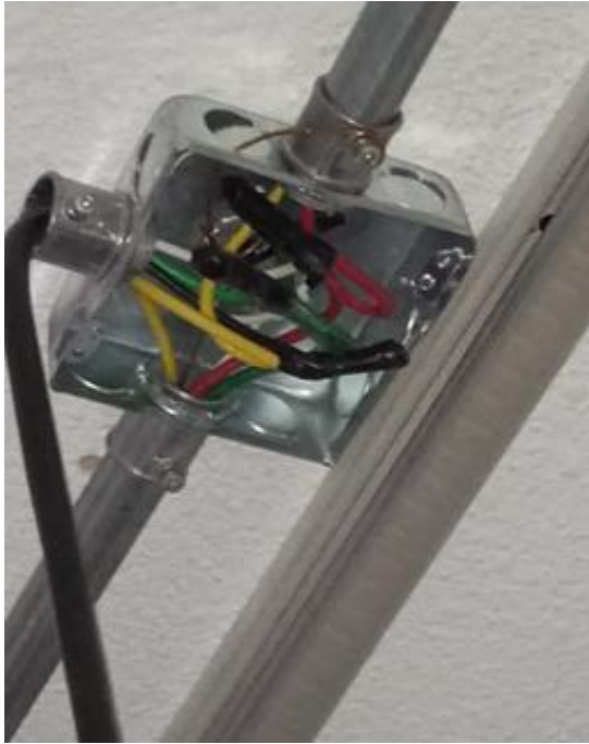
Imagen No. 3