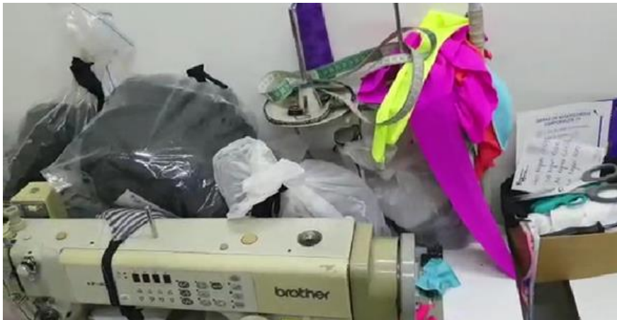
Imagen No. 14