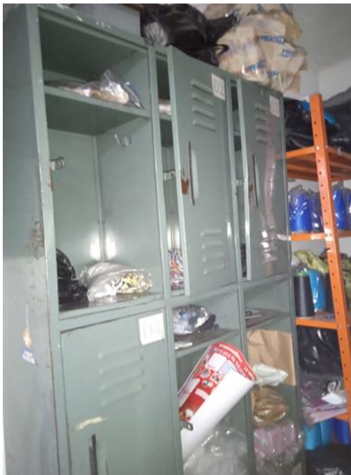
Imagen No. 12