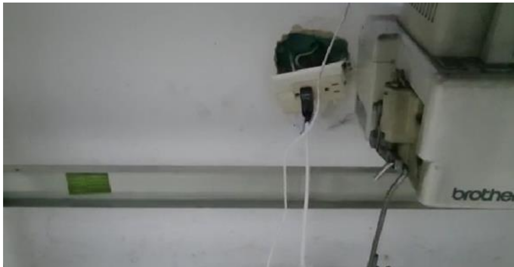
Imagen No. 7