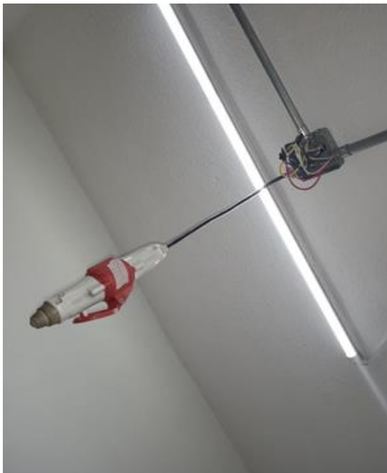
Imagen No. 4