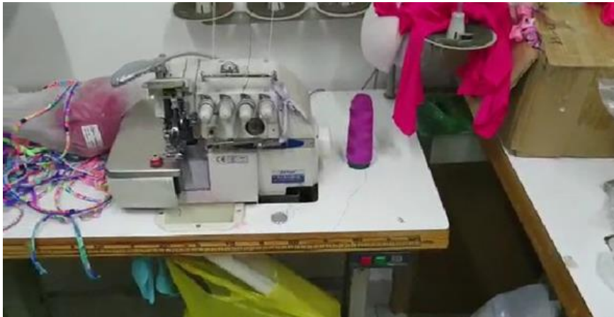
Imagen No. 13