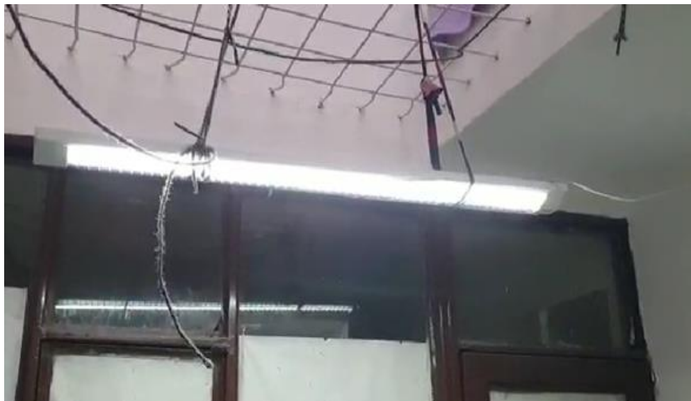
Imagen No. 8