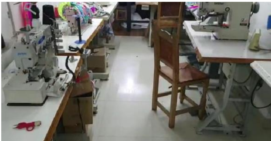
Imagen No. 2