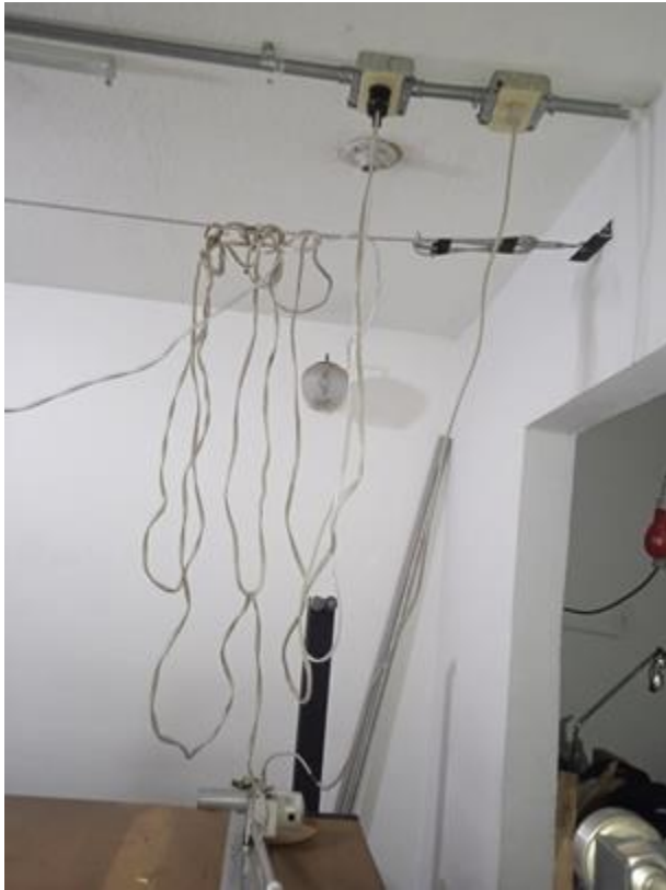
Imagen No. 5