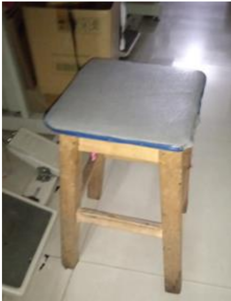
Imagen No. 10