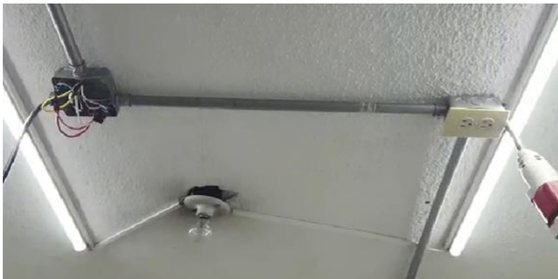
Imagen No. 6