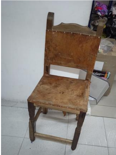
Imagen No. 9