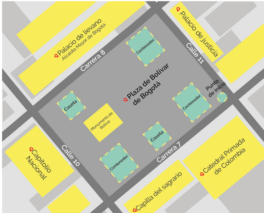
Figura 5. Plano recorrido de Bahazy . Elaboración propia

Recuerda que el sensor de tacto implementado en Bahazy debe detectar las casetas y contenedores para redirigir su desplazamiento evitando chocar con ellas y pueda afectarlos; posteriormente, debe seguir su trayectoria recolectando los contenedores que se encuentren llenos y los cuales serán reemplazados.