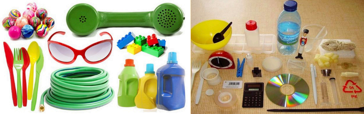
Figura 5. Tipos de plásticos.

Observa la siguiente imagen donde encontrarás diferentes plásticos, identifica cada tipo y escribe en tu bitácora según corresponda a cada elemento.