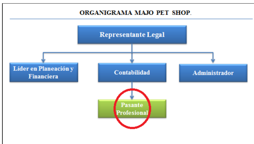
Figura 1 Organigrama de la organización MAJO PET SHOP., (Fuente: adaptación propia).