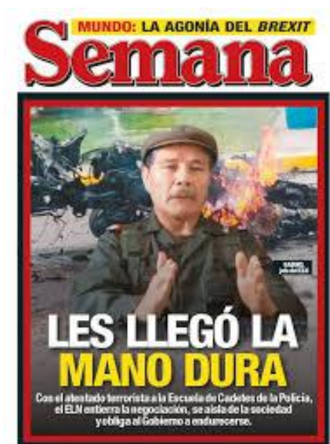
Figura 1. Portada Semana, especial del atentado a la Escuela General Santander de enero de 2019.

Políticamente, se ponen en la esfera de lo público los problemas profundos del país como