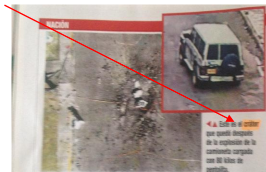
Figura 4. Fotografía automóvil y afectaciones de la vía por atentado.

terrorista son parte de un ejercicio de pedagogía de la crueldad (Segato, 2018) que enseña las