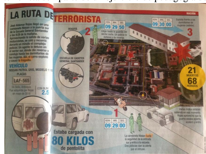
Figura 5. Detalle ruta.

particularidades del atentado y sugiere que cualquiera puede hacerlo, exacerbando el miedo y terror como respuesta a lo informado. Sobre algunos de los términos y calificativos usados en el discurso periodístico no se realizará análisis, ya que las hipótesis presentadas en la publicación