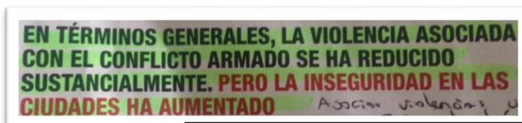
Figura 8. Conflicto armado e inseguridad.

conflicto armado interno y las afectaciones de la seguridad por la delincuencia común, por ello,