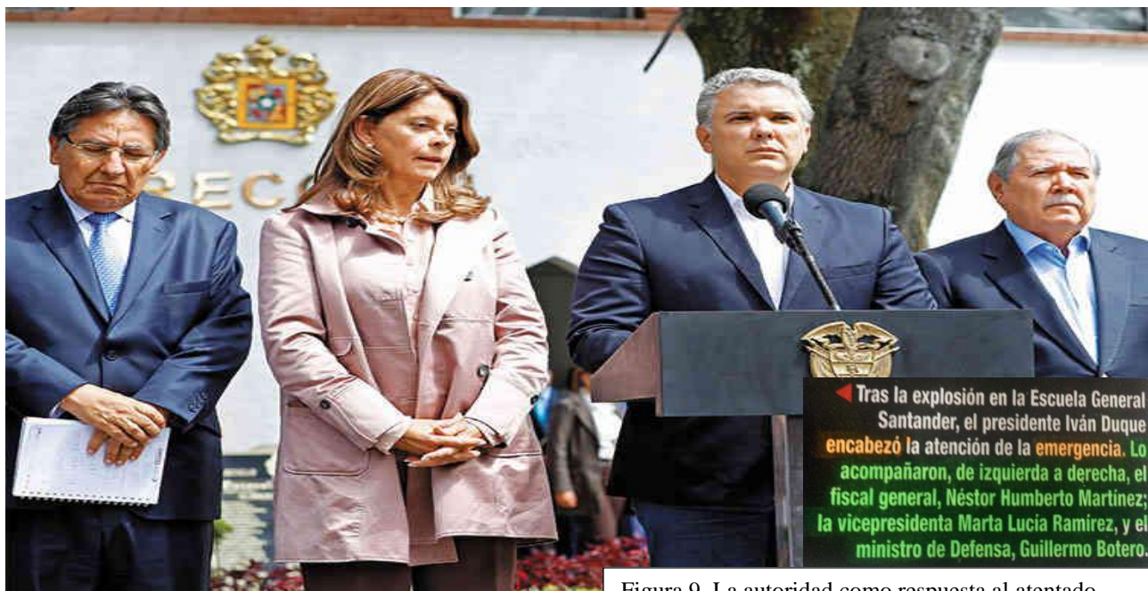
Figura 9. La autoridad como respuesta al atentado.

Finalmente, la edición presenta la siguiente imagen y cuadro de texto que contextualiza: