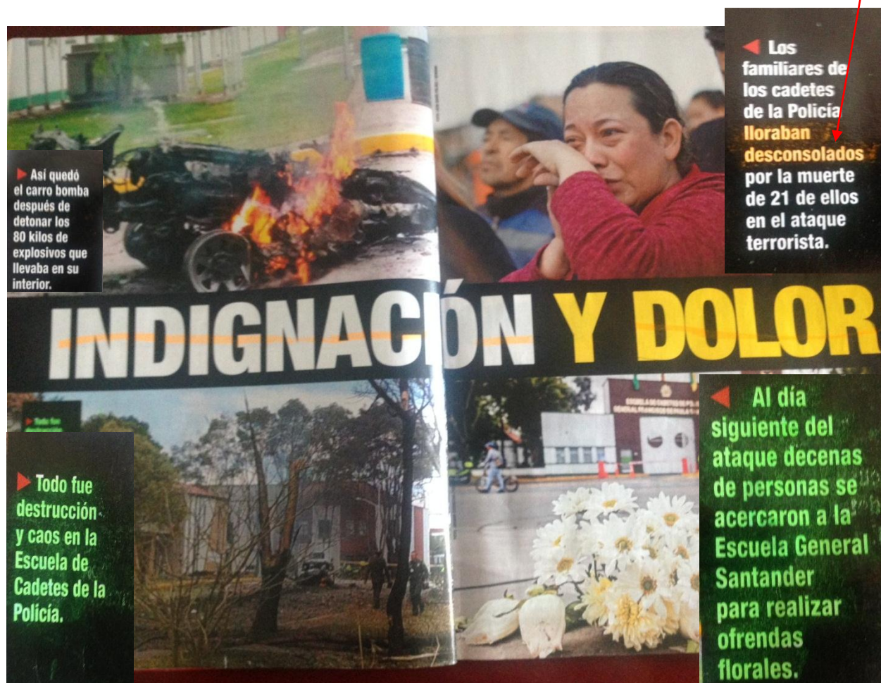
Figura 2. Vista interior del especial de Semana sobre el atentado a la Escuela General Santander en enero de 2019.

Al interior de la revista, para iniciar el especial sobre el atentado, aparece la siguiente imagen: