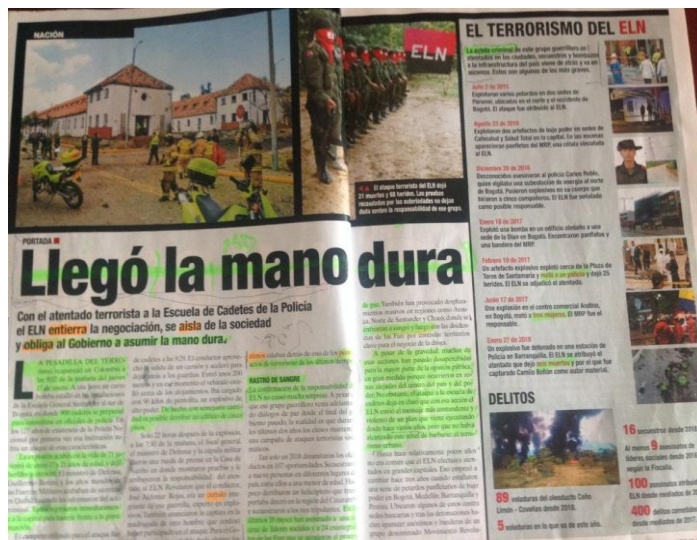
Figura 3. Vista general artículo “Llegó la mano dura”.

La información con la que se construye el artículo recopila las acciones del ELN en los últimos años, asociando las ilustraciones con una línea de tiempo. Las imágenes de los atentados y acciones del ELN, refuerzan la idea de la insuficiencia de los diálogos de paz, la falta de compromiso