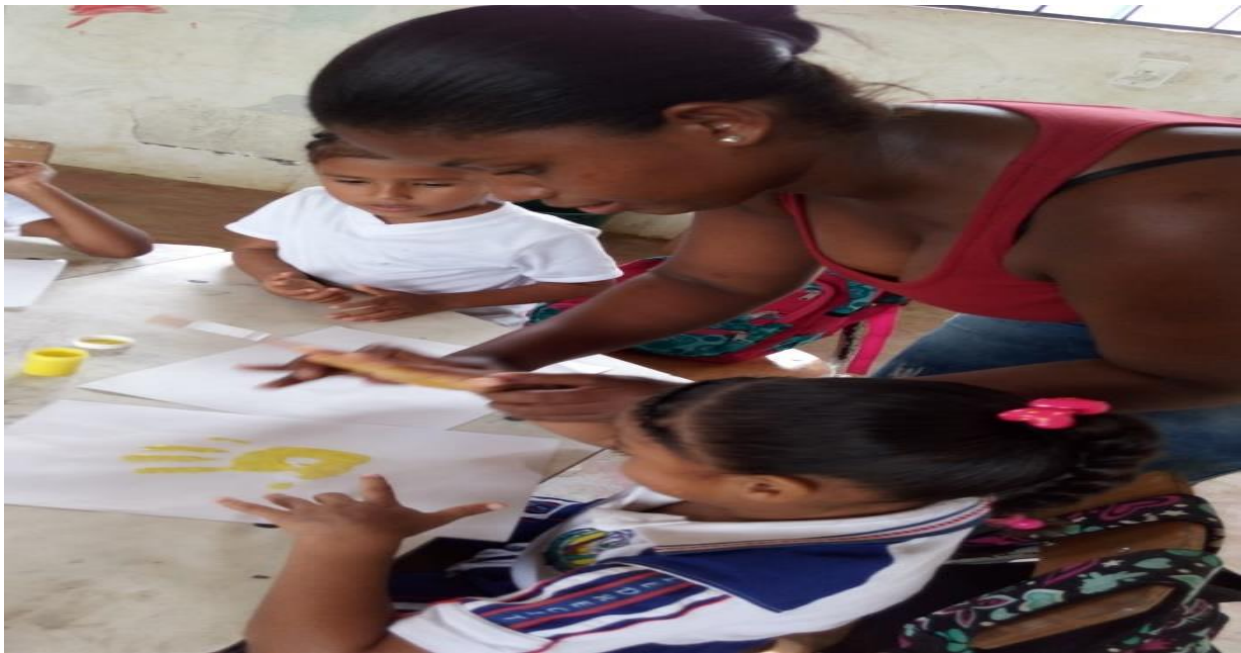
Ilustración 6 niños haciendo trabajo de dactilopintura