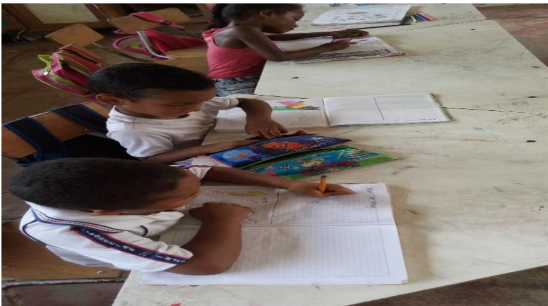
Ilustración 9 niños trabajando los valores