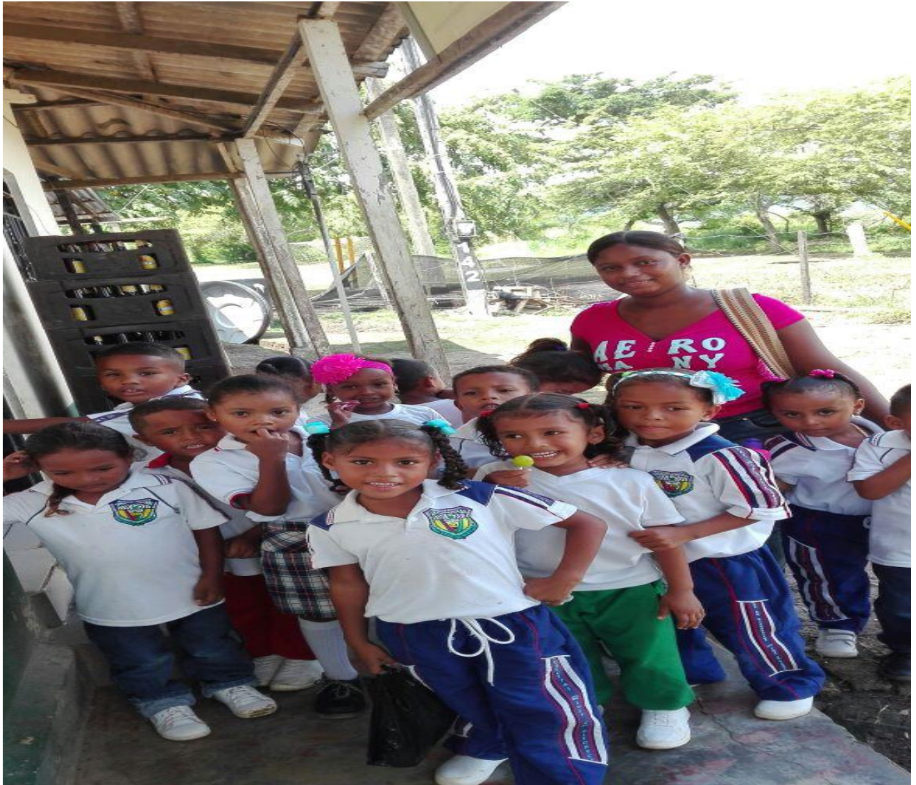
Ilustración 16 ultimo de visitas domiciliarias