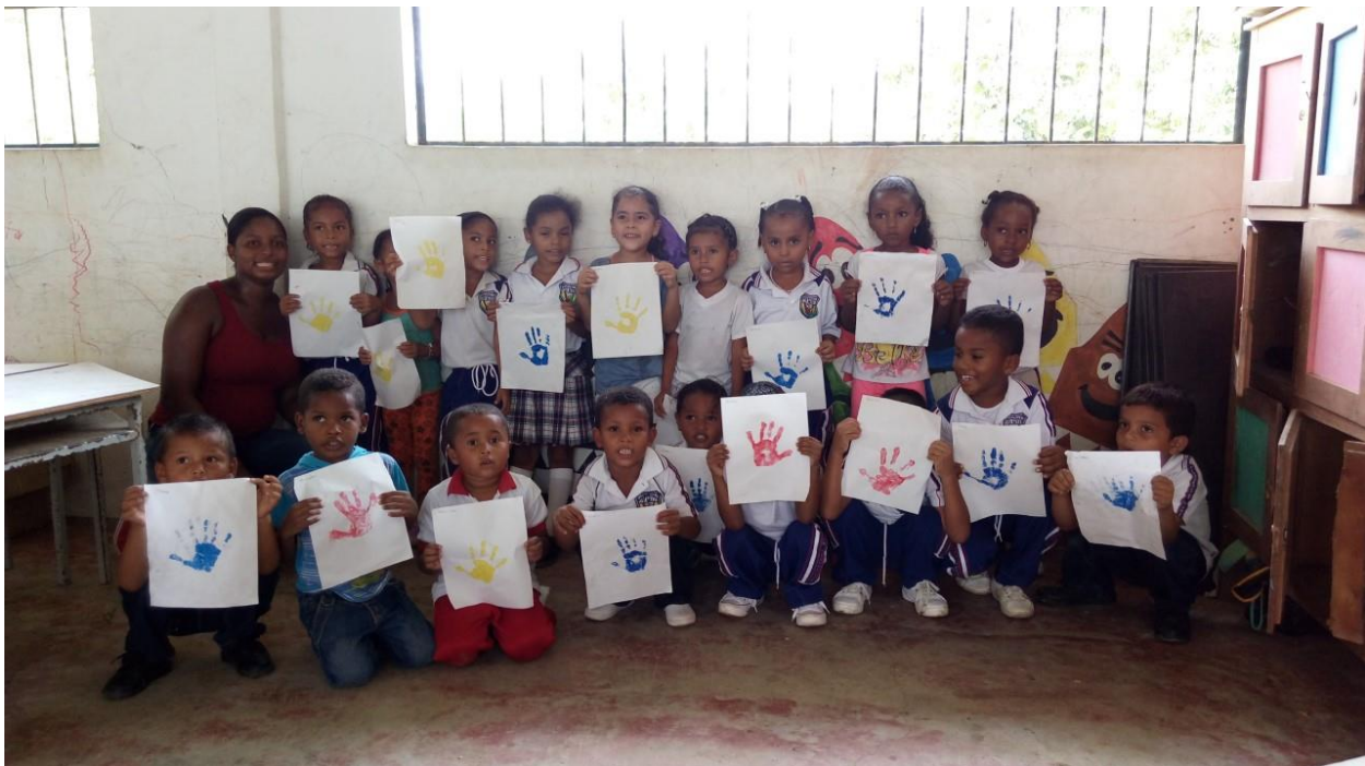
Ilustración 7 trabajo terminado de dactilopintura