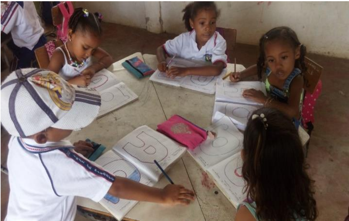
Ilustración 5 niños pintando la letra A mayúscula