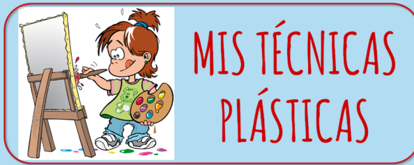
Ilustración 2 plan de sostenibilidad

Actividades sobre técnicas plásticas para afianzar la motricidad fina en niños de 4 y 5 años.