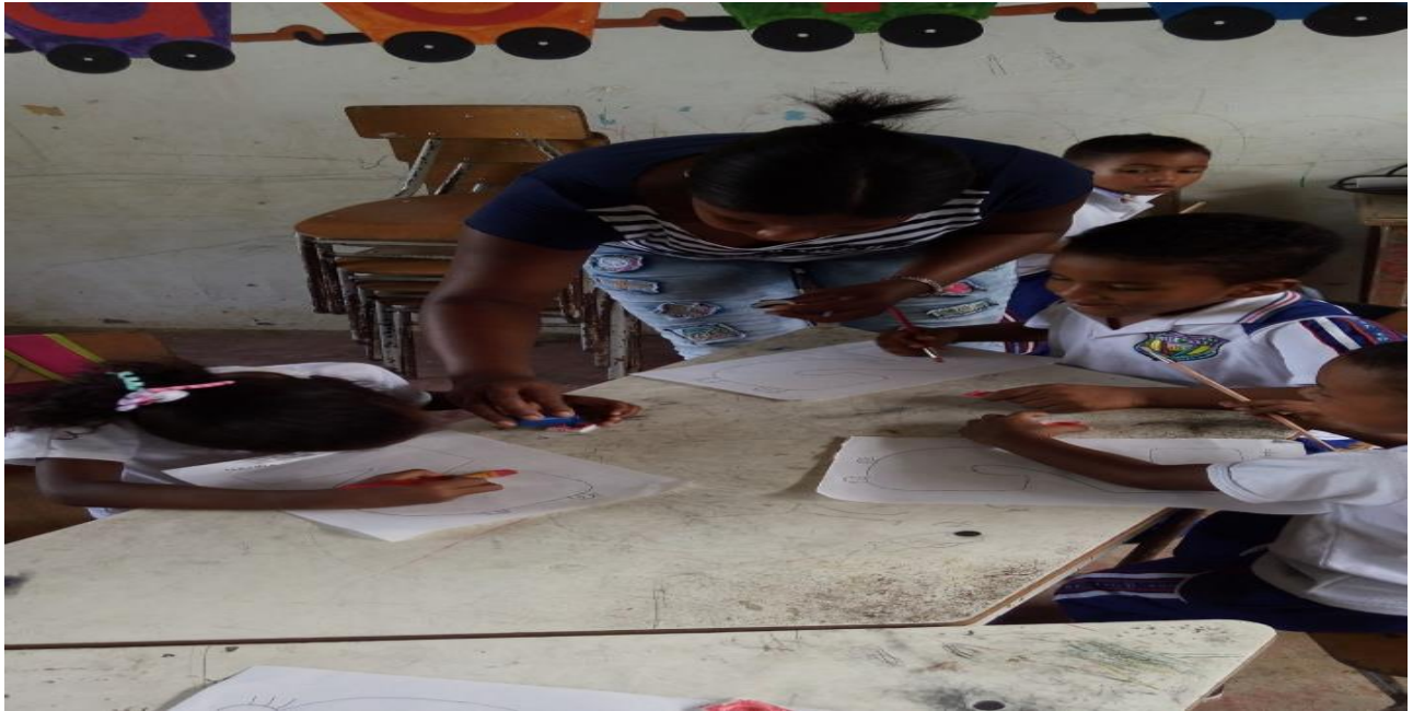
Ilustración 10 niños trabajando el número dos