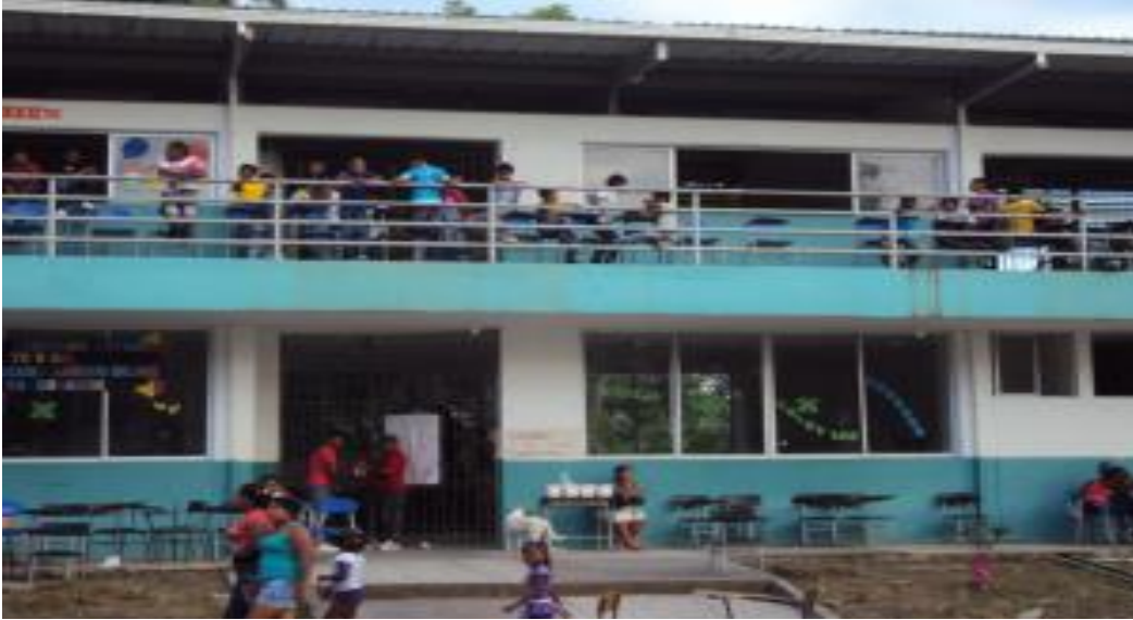
Ilustración 4 Institución Educativa Piedrecitas