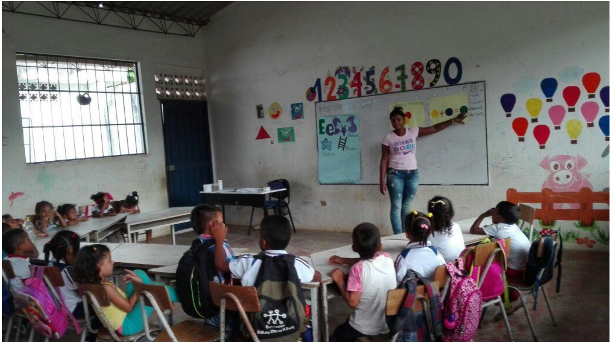
Ilustración 12 actividad de los colores y mezclas