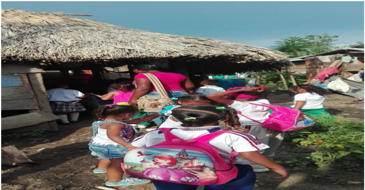
Ilustración 13 visitas domiciliarias