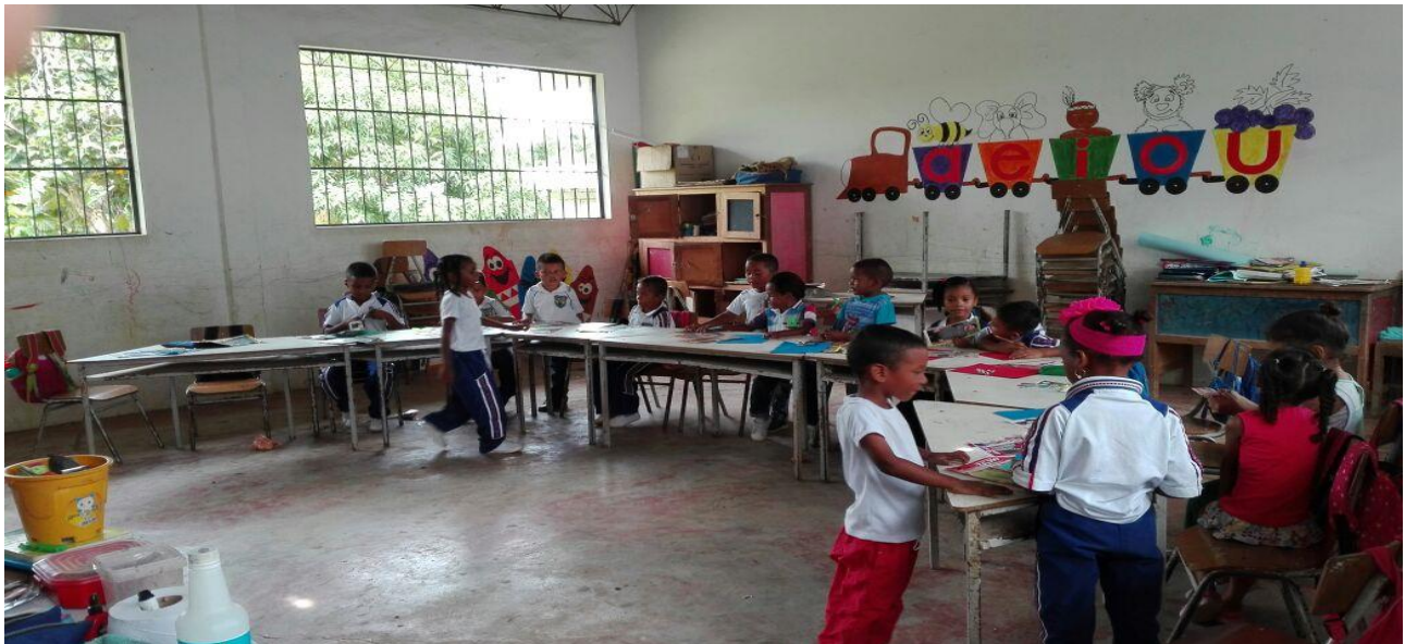
Ilustración 11 actividad del collage