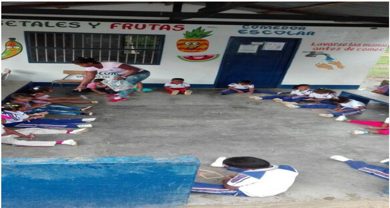
Ilustración 15 actividad libre con palitos de paletas