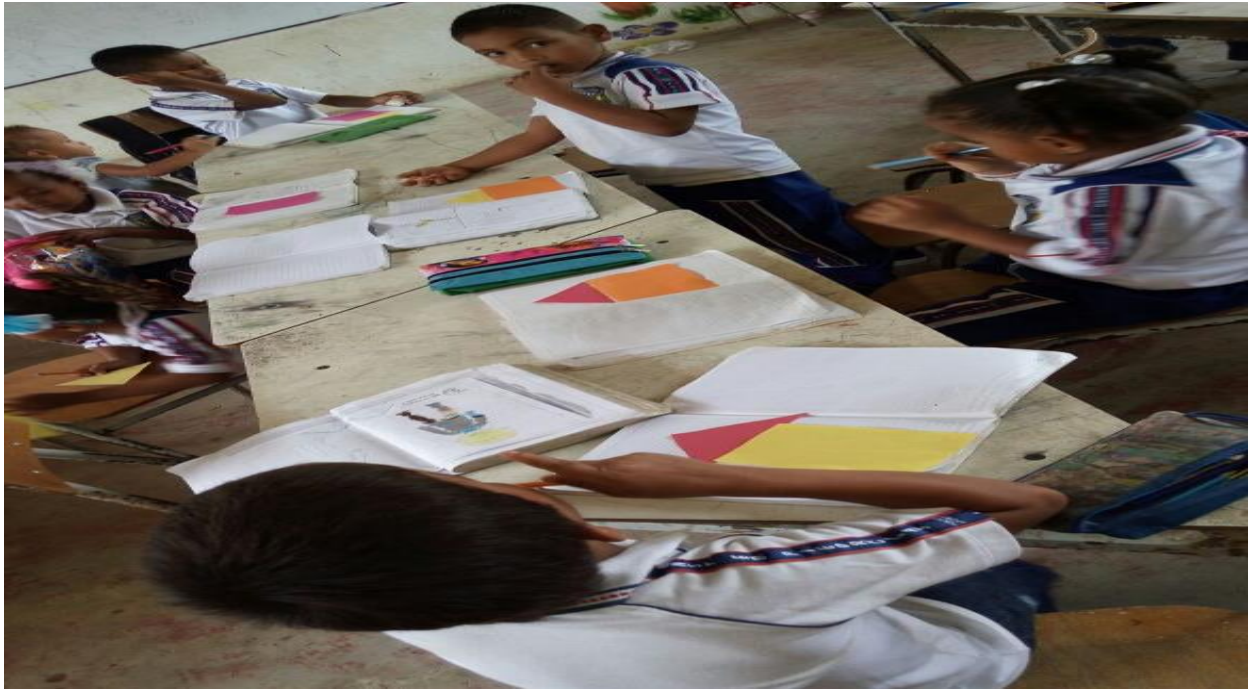
Ilustración 14 actividad de las figuras geométricas