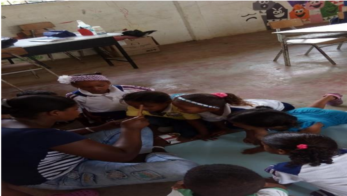
Ilustración 8 niños trabajando los colores