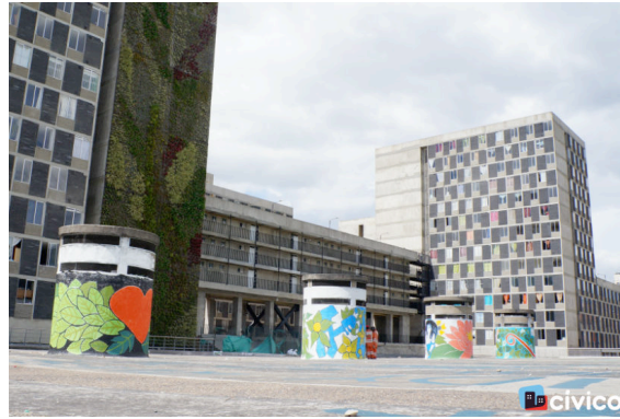
Figura 2 Parque de la hoja Fuente Plataforma Cívico (2015)