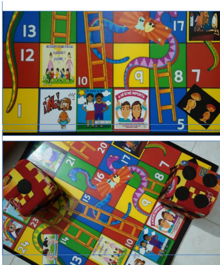
Figura Producto 1. Escalera

Grupo 2. Niños y niñas entre los 7 y 9 años de edad