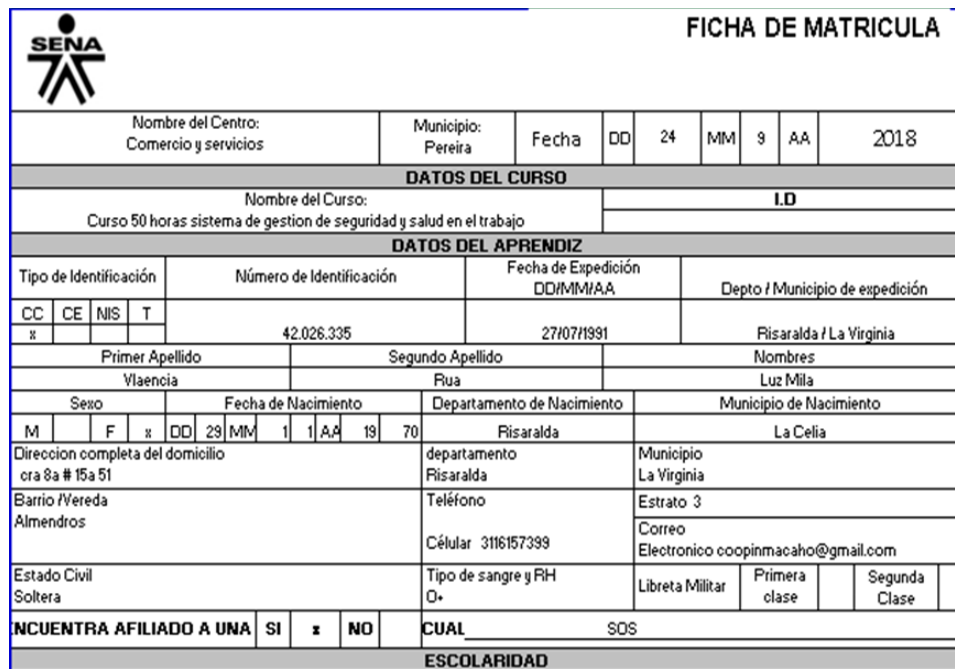
Ilustración 6. FICHA DE MATRÍCULA CURSO 50 HORAS