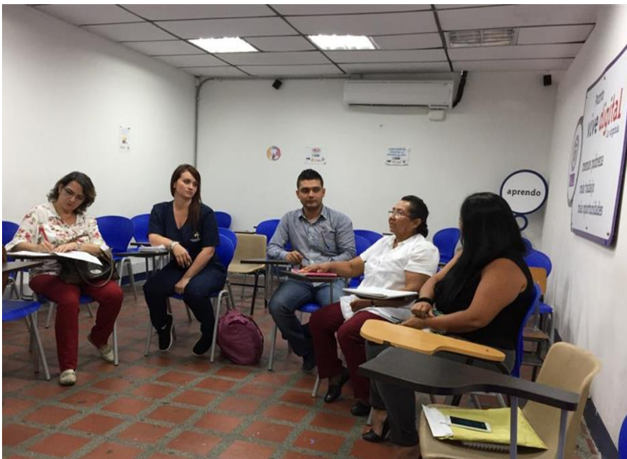
Ilustración 4. REUNIÓN FUNCIONARIOS ALCALDÍA Y COOPERATIVA

NOTA: Recuperado de informe final de práctica profesional (Pereira, 2018)