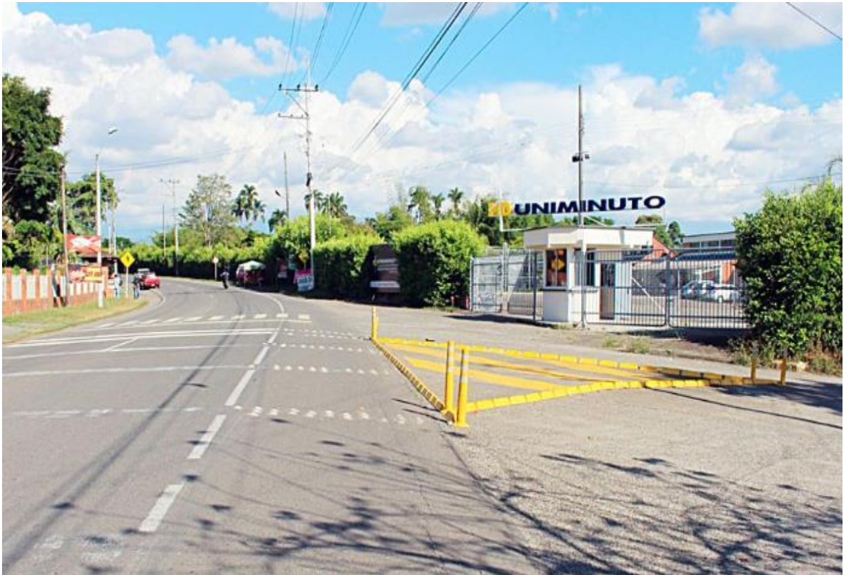
Ilustración 1. UNIMINUTO.