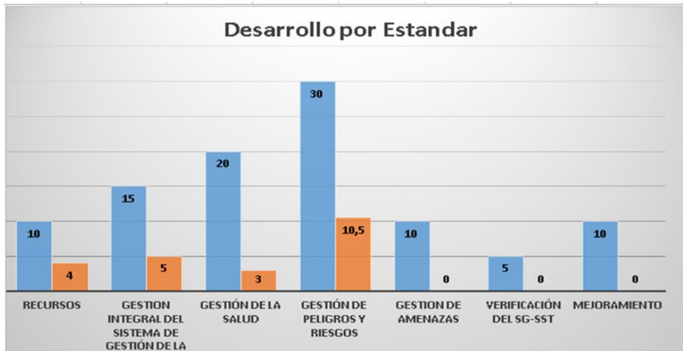
Ilustración 10. GRAFICO ACTUALIZACIÓN EVALUACIÓN INICIAL