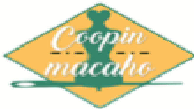
Ilustración 3. LOGO COOPERATIVA COOPIN MACAHO

Nota: Otorgado por la Cooperativa Coopin MacaHo