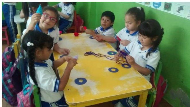
“Figura 6” Cortés, M (2014) Fotografía de clase de valores. Recuperado de la Practica II