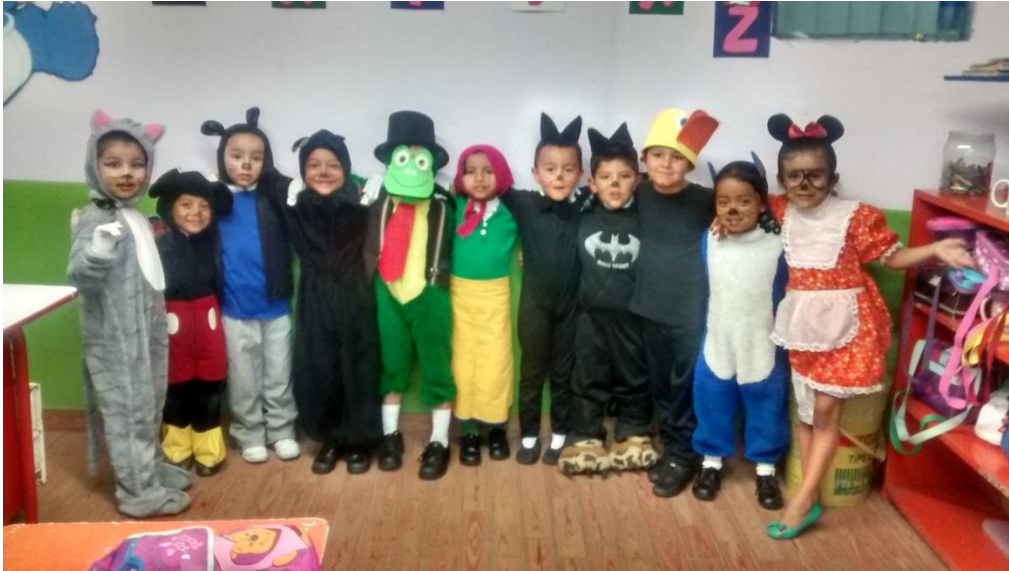
“Figura 4” Cortés, M (2014) Fotografía Juego de roles. Recuperado de la Practica II