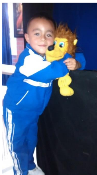
“Figura 3” Cortés, M (2014) Fotografía historia con titeres. Recuperado de la