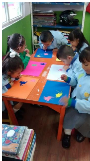
“Figura 7” Cortés, M (2015) Fotografía Juego personalidad. Recuperado de la Practica III