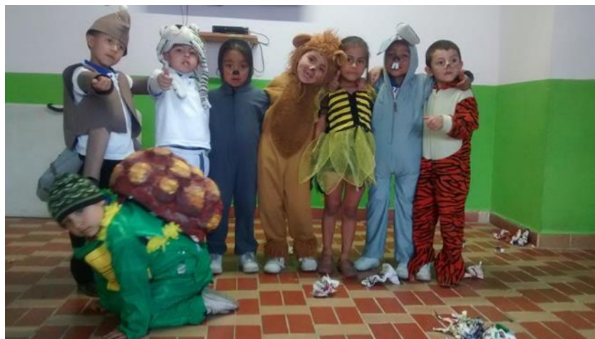
“Figura 5” Cortés, M (2014) Fotografía Juego de roles. Recuperado de la Practica II