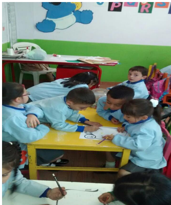
“Figura 2” Cortés, M (2014) Fotografía del trabajo en el aula. Recuperado de la