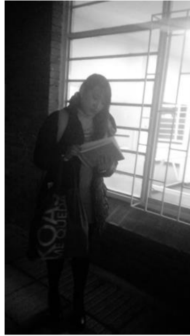
primera persona con el Fanzine