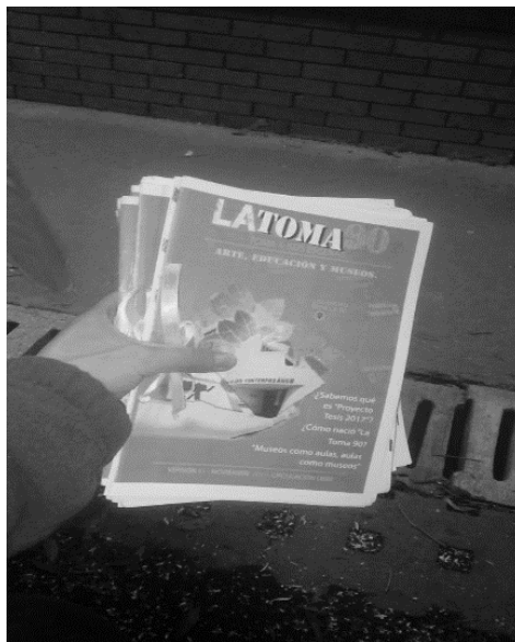
Fanzines de "La Toma"

Las fotografías tomadas en el desarrollo de la activación del fanzine, representado por los pasantes del 2018 y algunos estudiantes de la LBEA.