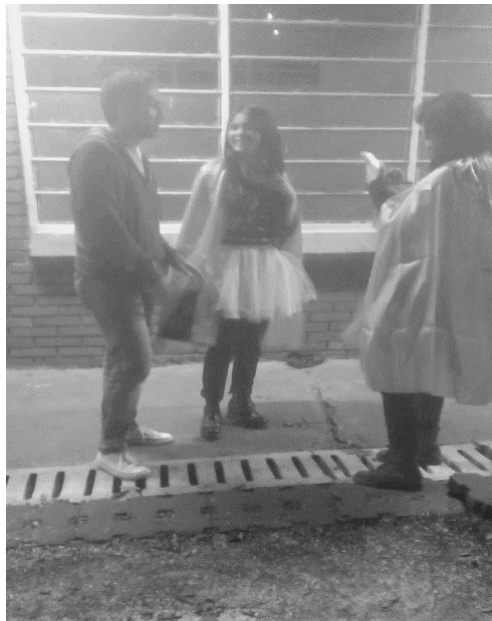
Entregando los Fanzines