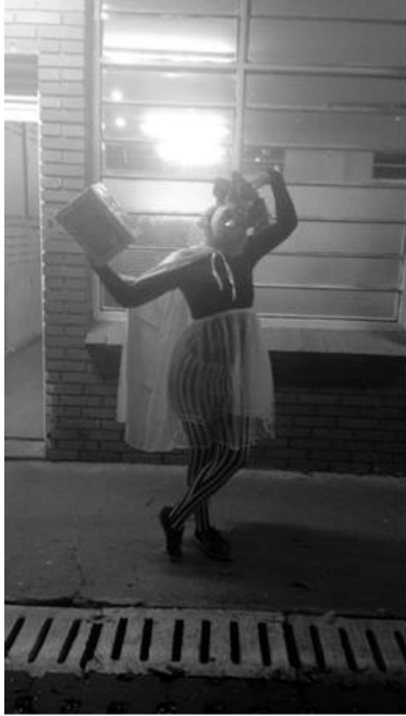
Disfras del circo de Venecia