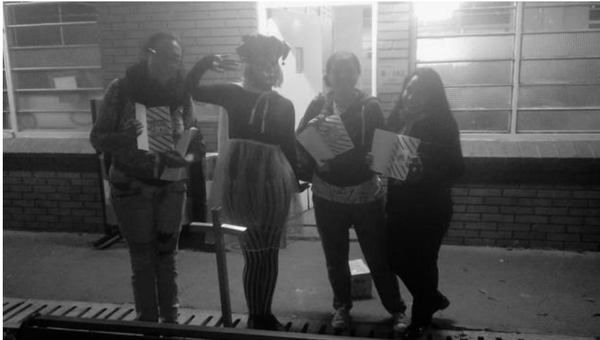
Entrega de Fanzines

Mayo 30 del 2018 en la sede 90 de la UNIMINUTO A las 8:30 pm