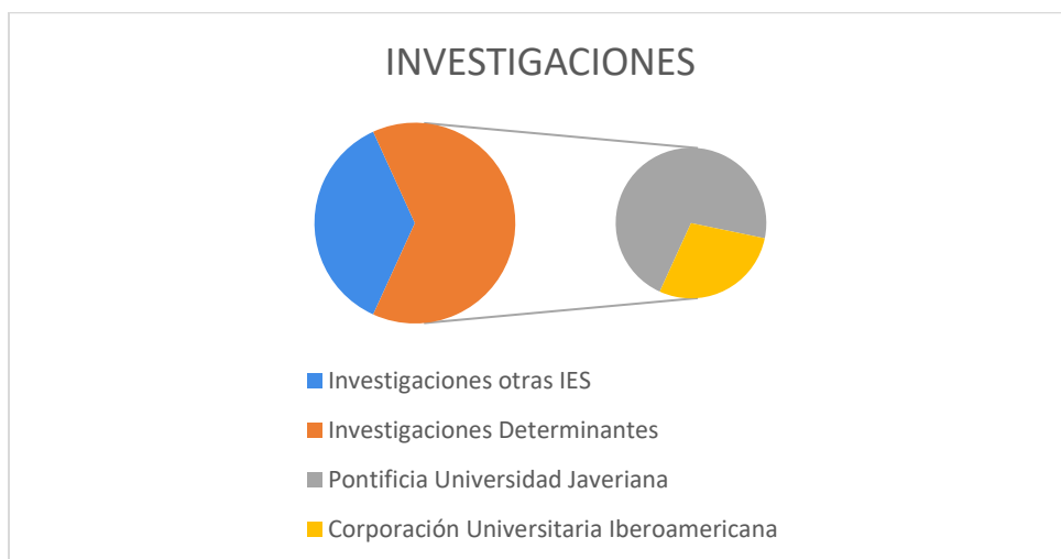
Ilustración 3 – Investigaciones

La incidencia del tema de investigación en los programas de pregrado se clasifica en las cinco (5) IES que tienen en sus repositorios los documentos referidos propios de este trabajo.