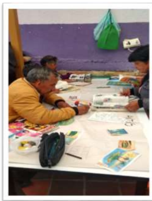
Centro día (Luisa Fernanda Rodriguez, 2017)