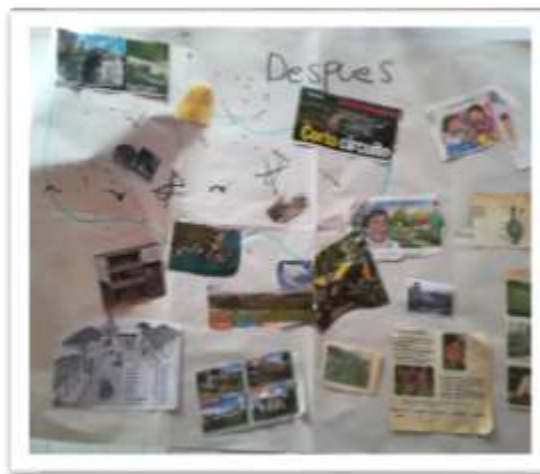
Colchas de memoria (después) 1