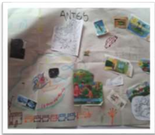
Colchas de memoria (antes) 1

continúa utilizando en algunos lugares y así mismo municipios en vías de desarrollo, como lo es actualmente Sibaté