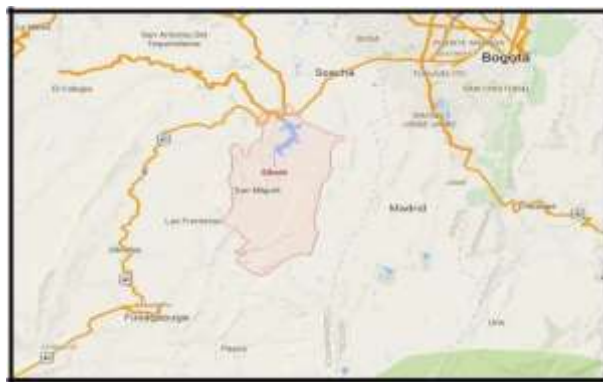
(Mi Municipio, 2017)

Sibaté es un municipio que se encuentra localizado a 25 kilómetros al Sureste de la Sabana de Bogotá, el territorio cubre la antigua Hacienda de Sibaté, y una parte de la Hacienda del Tequendama. (Plan de desarrollo del municipio de Sibaté).