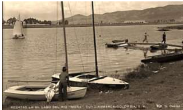
(Gumersindo Cuellar, 1950)

El tema ambiental integra a primera vista, problemas de calidad del recursos, por cuanto las aguas implicadas contienen agroquímicos, material de lavado por deforestación y extracción minera, orgánicos, químicos de industria de transformación, residuos químicos, grasas, aceites y metaloides; asociado a otros múltiples de cantidad de agua de estos diferentes afectados por la estacionalidad climática de la región, de embalsamiento de sus cauces, sin olvidar que las aguas del Río Bogotá, luego de pasar por 27 municipios arrastran dichos vertidos al embalse, generando un conflicto adicional de competencia por el recurso, gobernanza frente a los usos de los diferentes usuarios dedicados a la agricultura, industria, consumo para las poblaciones de la cuenca baja y recreación paisajística, por mencionar los más sobresalientes, a más de la presencia nominal de autoridades encargadas de su administración, como la Corporación Autónoma Regional de Cundinamarca, los municipios de la cuenca y más notablemente desde 2005 el Tribunal Administrativo de Cundinamarca, que falló en primera instancia y luego el Consejo de Estado en segunda instancia, por acumulación de procesos, que permite la Ley 472 de 1998 sobre acciones populares y de grupo, buscando el saneamiento del Río Bogotá.