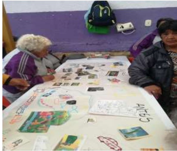
Centro día (Luisa Fernanda Rodriguez, 2017)