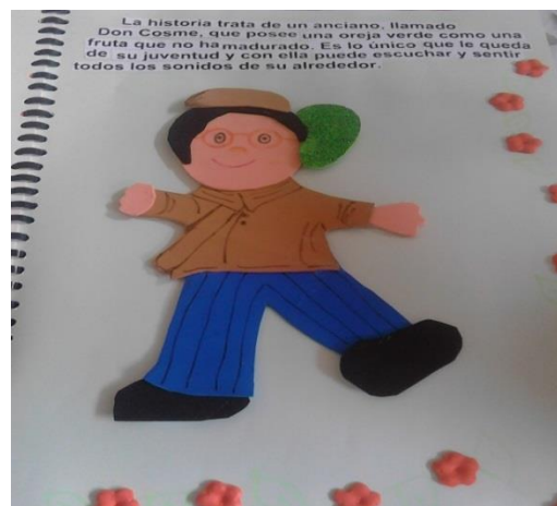
Ilustración 9. Apoyos didácticos