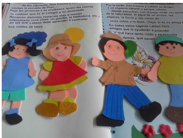
Ilustración 10. Apoyo didáctico