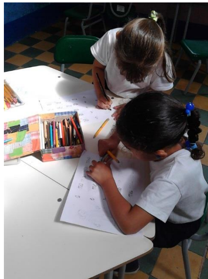
Ilustración 3. Desarrollo de actividades