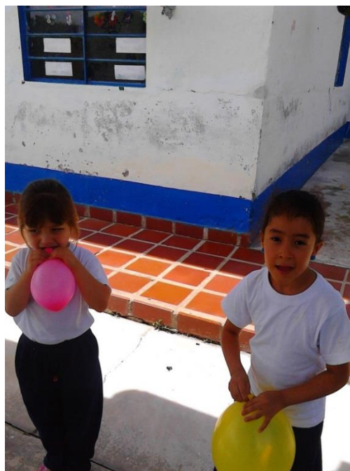
Ilustración 8. Actividades al aire libre