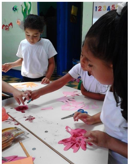
Ilustración 6. Desarrollo de actividades