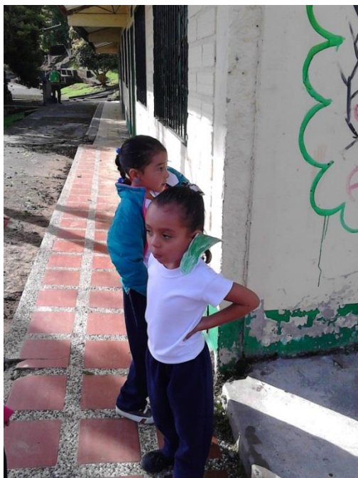
Ilustración 7. Actividades al aire libre