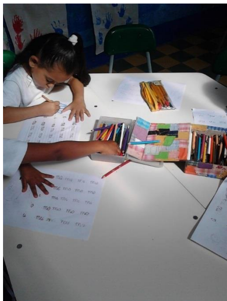
Ilustración 4. Desarrollo de actividades