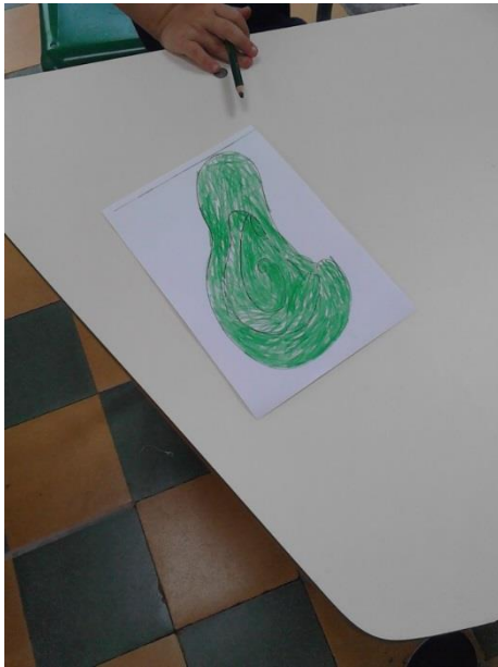
Ilustración 1. Trabajo de estudiantes