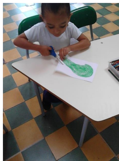
Ilustración 5. Desarrollo de actividades