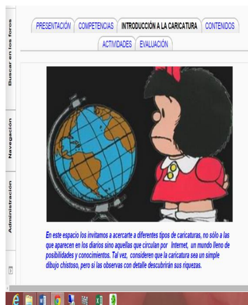
Ilustración 3 Secciones del AVA

llamado Competencias en caricatura] y Actividades [Se proponen tres actividades, en la actividad uno se pide que creen textos para seis caricaturas; en la dos, diseñarán una tira cómica en Pixton , luego de ver el tutorial de su manejo y en la actividad tres, deben mandar un archivo de audio con la imitación de las voces de dos personajes de la política exponiendo una problemática actual]. Por último está la parte correspondiente a la Evaluación , donde aparece la rúbrica con los criterios que serán evaluados en las diferentes actividades.