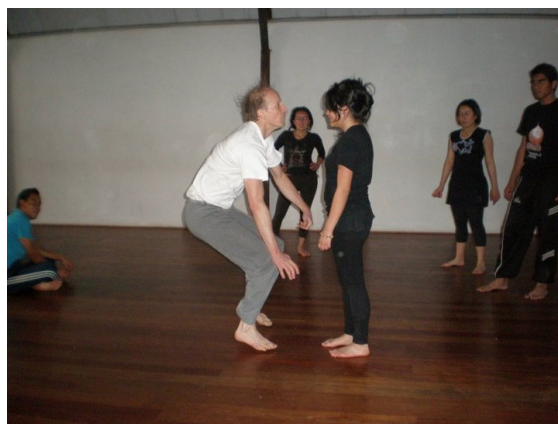
Ilustracion 5: Clase de cuerpo proceso formativo