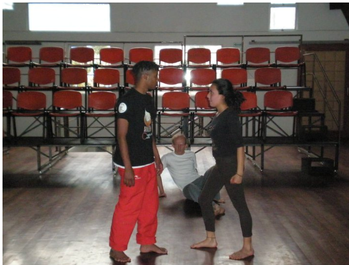
Ilustracion 4: Clase de cuerpo proceso formativo