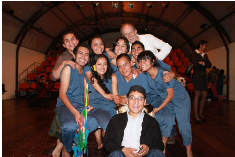
Ilustracion1: Presentacion de Verde Olivo