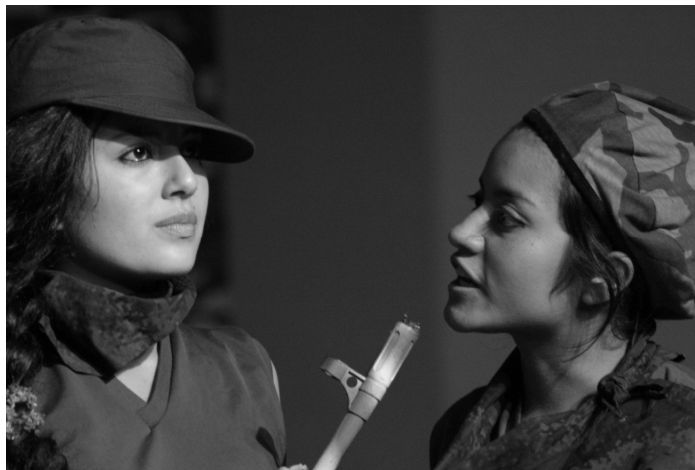
Ilustracion 7: Presentacion de la Obra Verde Olivo