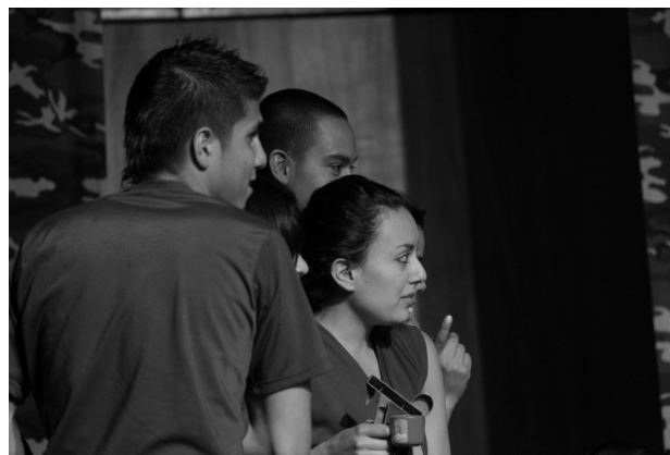
Ilustracion 2: presentacion de la obra Verde olivo