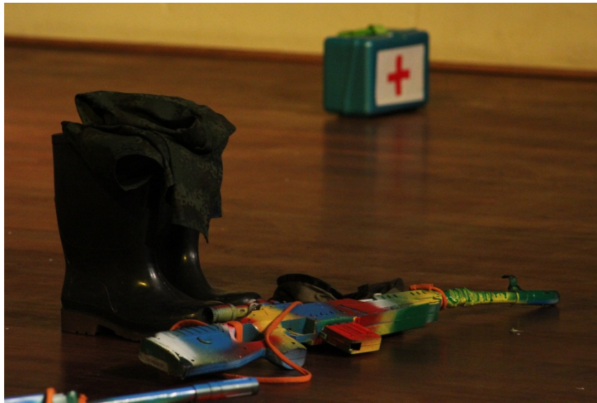
Ilustración 8: presentación de la Obra Verde Olivo