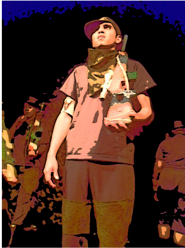
Ilustracion 6: Presentacion de la Obra Verde Olivo