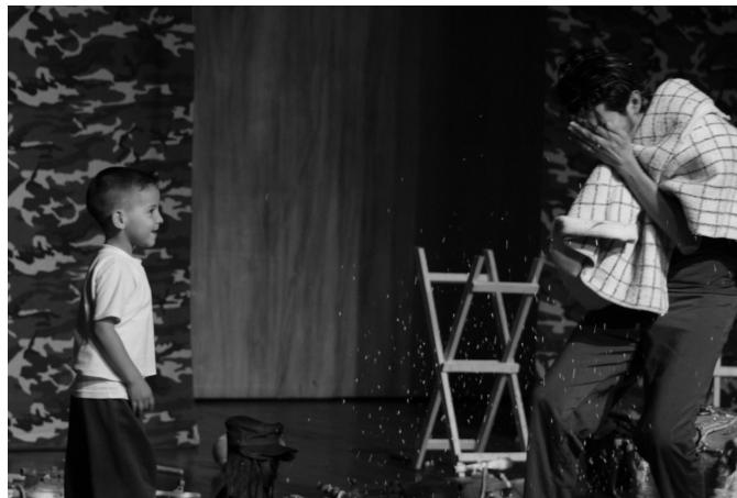
Ilustración 9: Presentación de la obra Verde olivo