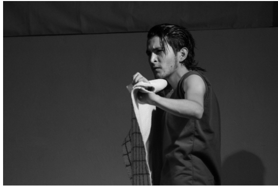
Ilustracion 3: Presentacion de la obra Verde Olivo