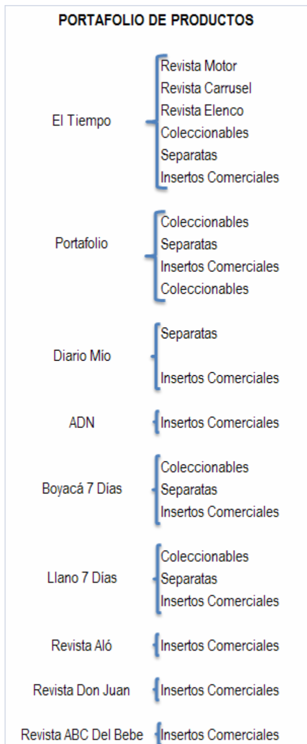
Imagen No. 1 Portafolio de Productos Sección Empaque