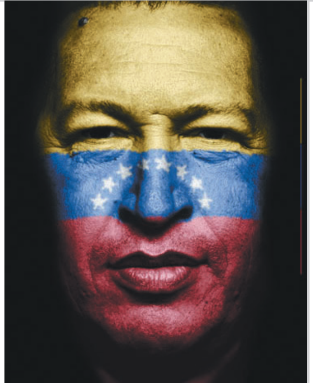
FOTOMONTAJE - Juan Camilo Bolaño

Entre las preguntas del público estuvo el tema del periodismo en Venezuela a lo que Guanella respondió que es un periodismo totalmente militante con el chavismo.