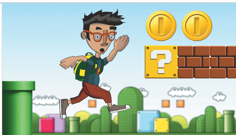
ILUSTRACIÓN - Juan Camilo Bolaño

Un crédito académico es la unidad que mide el tiempo de actividad académica del estudiante en el semestre. El Ministerio de Educación Nacional a través del Decreto 2566 de septiembre 10 de 2003 establece que “un crédito equivale a 48 horas de trabajo académico del estudiante, que comprende las horas con acompañamiento directo del docente y demás horas que el estudiante deba emplear en actividades independientes de estudio”. Es decir, en una semana un crédito académico implica una hora presencial con el profesor y dos horas adicionales de trabajo independiente o autónomo por