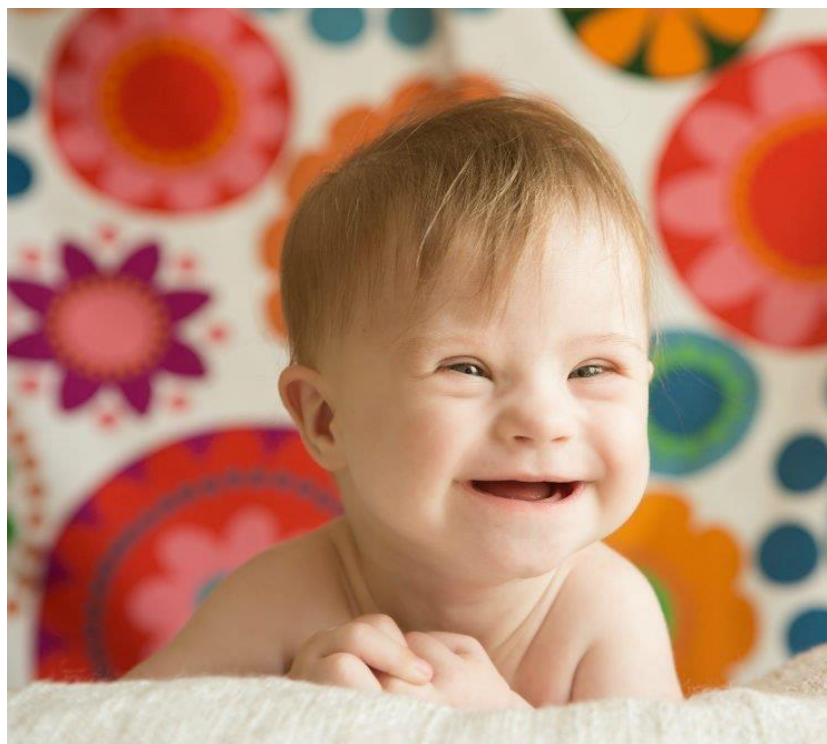
Figura 5. El síndrome de Down.

Muñoz (2004) menciona que las principales características de esta afección son: un rostro aplanado, cabeza pequeña, cuello corto, lengua protuberante, orejas pequeñas, poco tono muscular, dedos de los manos relativamente cortos, manos y pies pequeños, flexibilidad excesiva, la mayoría de los niños con SD tienen deterioro cognitivo de leve a moderado, presentan retrasos en el lenguaje y problemas de memoria a corto y largo plazo. La mayoría de los niños con SD presentan alguna otra condición médica, pueden sufrir de lesiones en su piel por ser tan gruesa y reseca, otros presentan afecciones cardíacas, problemas en la glándula tiroidea y en su mayoría dificultad del habla y visión.