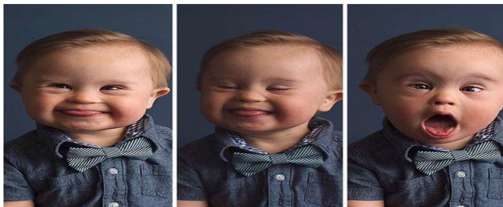
Figura 6. Características del SD.