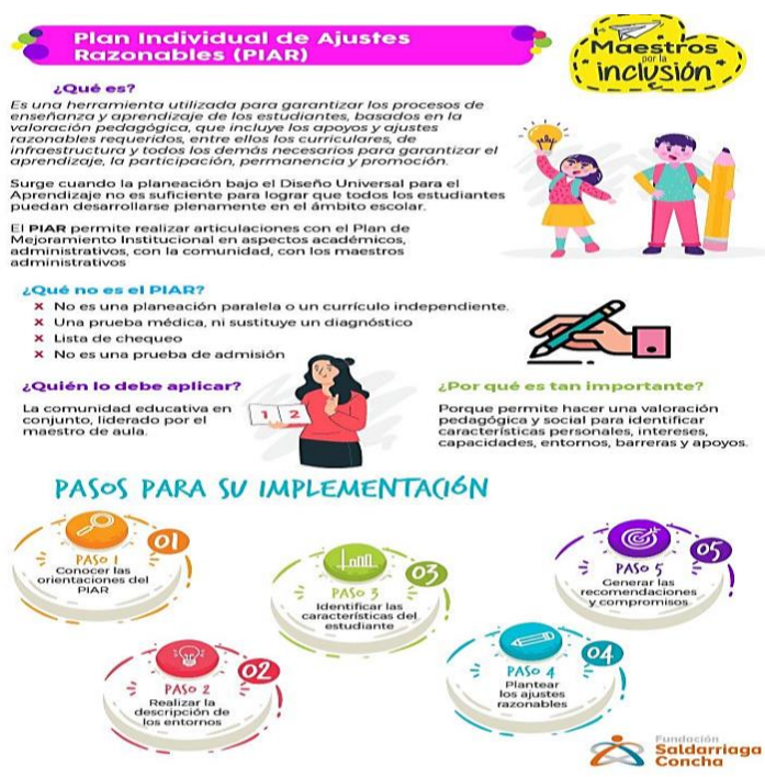
Figura 4. Plan Individual de Ajustes Razonables.