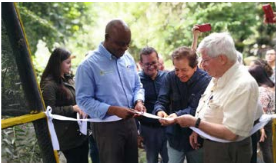
Inauguración del Agroparque Sabio Mutis

https://elcampesino.co/nuevo-jardin-botanico-en-colombia/