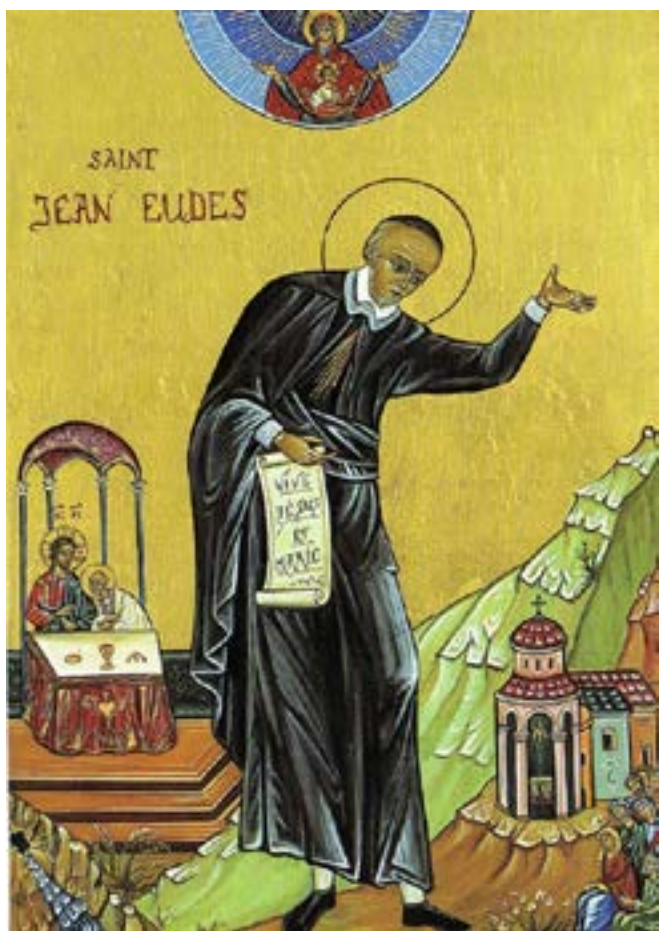
San Juan Eudes, sacerdote.

https://www.buenpastor.cl/index.php/quienes-somos/archivo-de-notas/notas-ano-2016/19-notas-ano-2016/480-san-juan-eudes-sacerdote