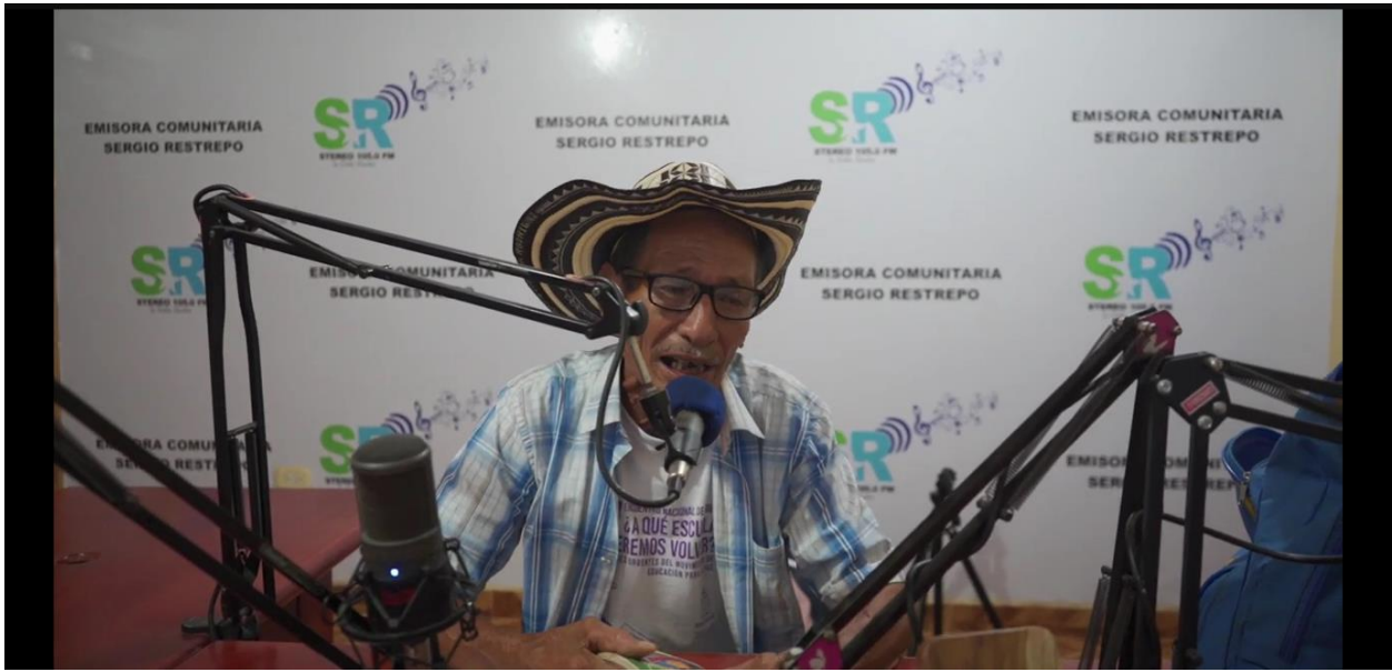
Fotografía 3. Programa radial "El Sinú Ayer y Hoy: Un Festival en el Aire"