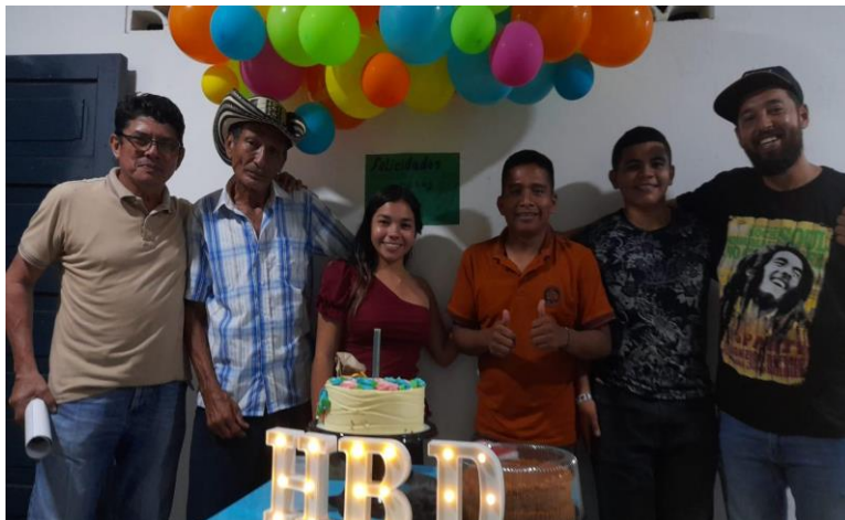
Fotografía 4. Celebración del cumpleaños del Poeta de Callejas con el Cineclub

En colaboración con los aliados, se decidió iniciar un proceso cultural que hoy en día está consolidado como el "CineClub La Cotorrita del Sinú - Kekerrezhake". Este proceso ayuda a propiciar una agenda que permite alquilar "La Casa Intercultural para la Paz del Alto Sinú", con el propósito de ofrecer un lugar de tránsito para el Poeta de Callejas en el municipio de Tierralta. Asimismo, se busca contribuir a la reconstrucción del tejido social a través de la creación de un espacio cultural que permita la reivindicación de voces populares y la promoción de la cultura local.