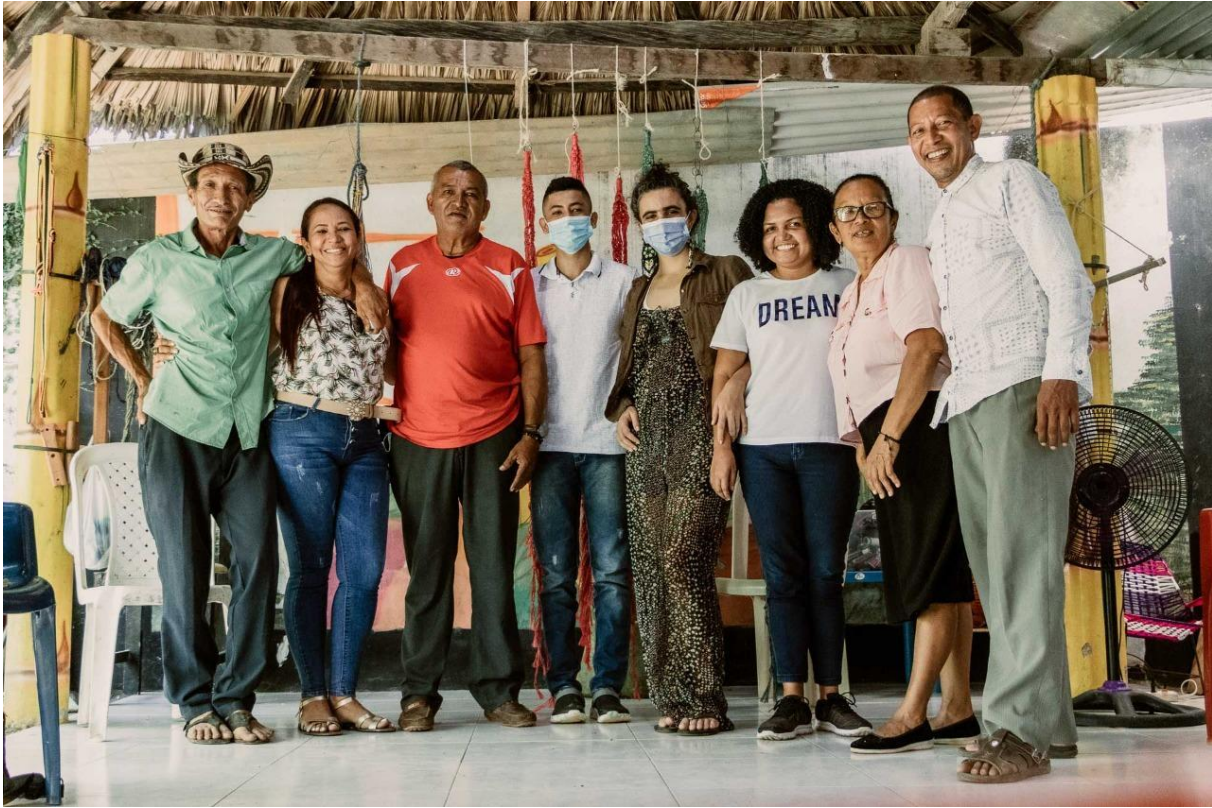
Fotografía 2. Amigos del Poeta

municipal permita propiciar escenarios de culturales y de divulgación que contribuya a la reconstrucción del tejido social.