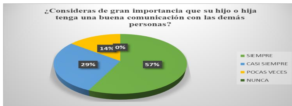
Gráfica 4 Importancia de la comunicación con las demás personas

De acuerdo con el resultado arrojado podemos ver cómo un 43% de los padres expresa que (siempre) evidencian que sus hijos entablan diálogos coherentes con sus pares por medio de la expresión verbal, pero un 29% indica que (pocas veces) identifican este tipo de sucesos. (Gráfica 5), esto quiere decir que son más los padres de familia los que están al tanto de la comunicación de sus hijos con sus compañeros.