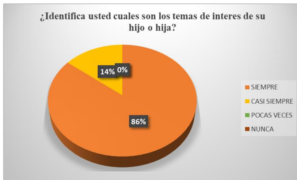
Gráfica 6 Temas de interés de su hijo o hija

concluir que los padres reconocen lo que les gusta comunicar a sus hijos y los temas que con frecuencia desarrollan