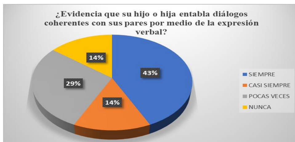
Gráfica 5 Diálogos coherentes entre pares

De acuerdo con el resultado arrojado podemos ver cómo un 43% de los padres expresa que (siempre) evidencian que sus hijos entablan diálogos coherentes con sus pares por medio de la expresión verbal, pero un 29% indica que (pocas veces) identifican este tipo de sucesos. (Gráfica 5), esto quiere decir que son más los padres de familia los que están al tanto de la comunicación de sus hijos con sus compañeros.