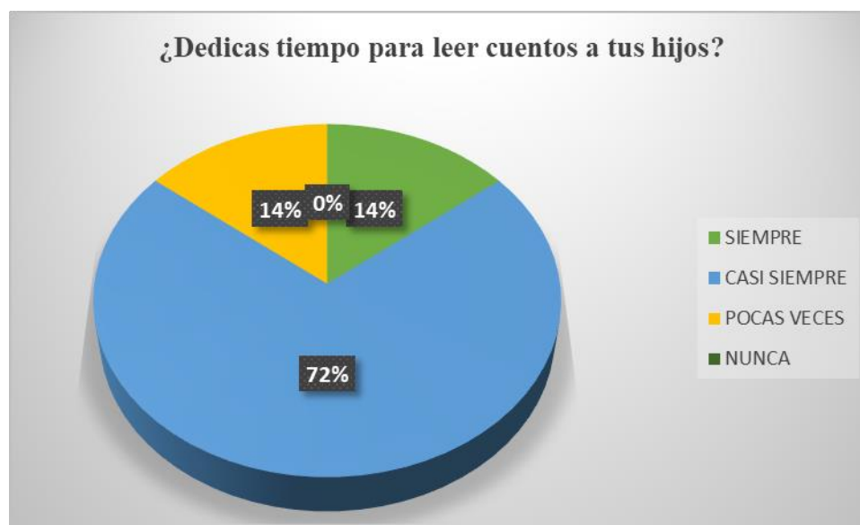
Gráfica 3 Tiempo dedicado para leer cuentos

De acuerdo a la pregunta se puede evidenciar que un 72% (casi siempre) la mayoría de los padres dedican tiempo para leer cuentos a sus hijos. (Grafica 3), esto significa que los padres de familia se interesan por compartir diversos espacios con sus hijos.