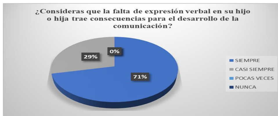
Gráfica 7 Consecuencias de la expresión verbal para el desarrollo de la comunicación