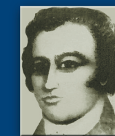
Don Manuel Torres Primer Diplomático Colombiano