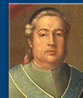
Arzobispo Virrey don Antonio Caballero y Góngora