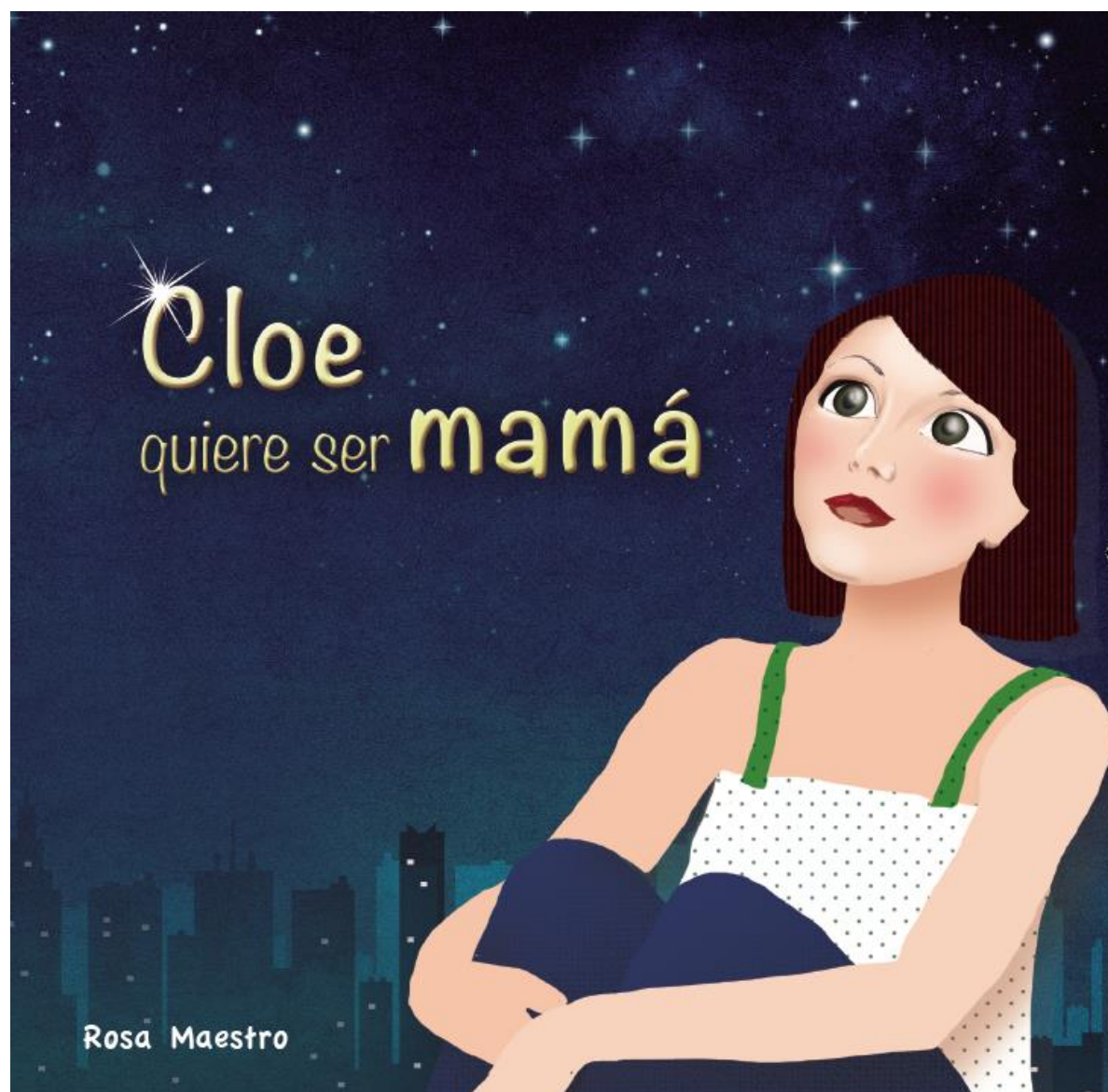
Figura 4. Portada cuento “Cloé quiere ser mamá”

Nota. Tomado de Rovira (2020) para fines pedagógicos.