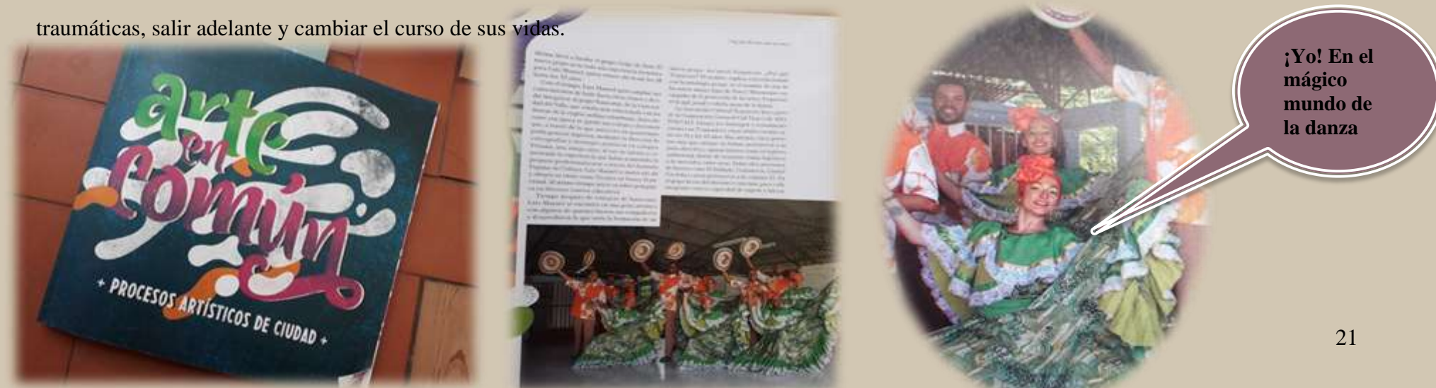
Referencia artística - Asociación cultural Terpsícore Arte en mi comuna 2019- la cual fui bailarina y enmarcamos procesos culturales y artísticos muy significativos para la ciudad.

Por ultimo mencionaremos la importante labor que tiene la casa cultural el chontaduro ubicado en el barrio charco azul, cuyo centro se dedica a los procesos y eventos comunitarios donde le apuestan a un proyecto artístico que perdure en el tiempo como una forma de conexión y afirmación con sus raíces, estos procesos que se vienen dando en el distrito de Aguablanca a través del folclore son procesos que se trabajan desde una identidad colectiva – grupal, esta identidad colectiva que se logra establecer permite que esas personas tengan una percepción crítica de sus realidades a nivel social, cultural, familiar e individual, miradas que buscan respuestas muchas veces a esa injusta violencia y vulnerabilidad a la que se encuentran sometidos por vivir en un barrio periférico de la ciudad; la importancia de trabajar la danza desde un enfoque de desarrollo y rescate de identidad individual sin dejar de lado la identidad colectiva les permite comprender la causa de esas experiencias dolorosas, con aprendizajes para, trabajar en el ser y el desarrollo pleno de identidad, así mismo podrán sanar esas experiencias traumáticas, salir adelante y cambiar el curso de sus vidas.