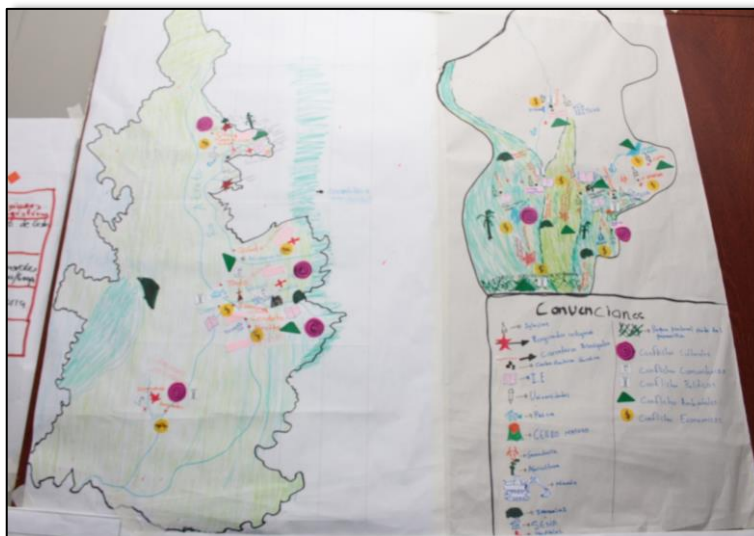
Figura 3. Cartografía social subregión Córdoba, Urabá - Chocó.

Al abordar la cartografía social y la matriz descriptiva de conflictos para esta subregión, fue posible evidenciar la particularidad que tiene este territorio debido a su posición geográfica como zona de frontera hacia Panamá y corredor que comunica con Centroamérica. La subregión está constituida por la mayor parte del departamento del Chocó, el municipio de Mutatá en el Urabá antioqueño y la mayor parte del departamento de Córdoba.