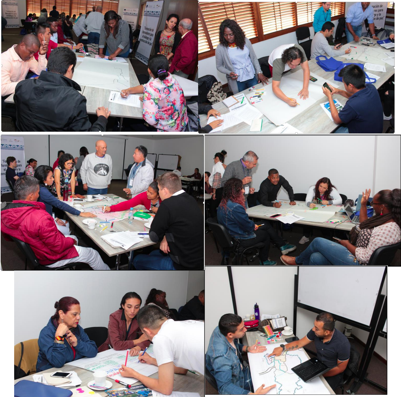
Figura 1. Construcción de cartografías sociales por subregiones durante la segunda sesión de formación (Bogotá, Julio, 2019).