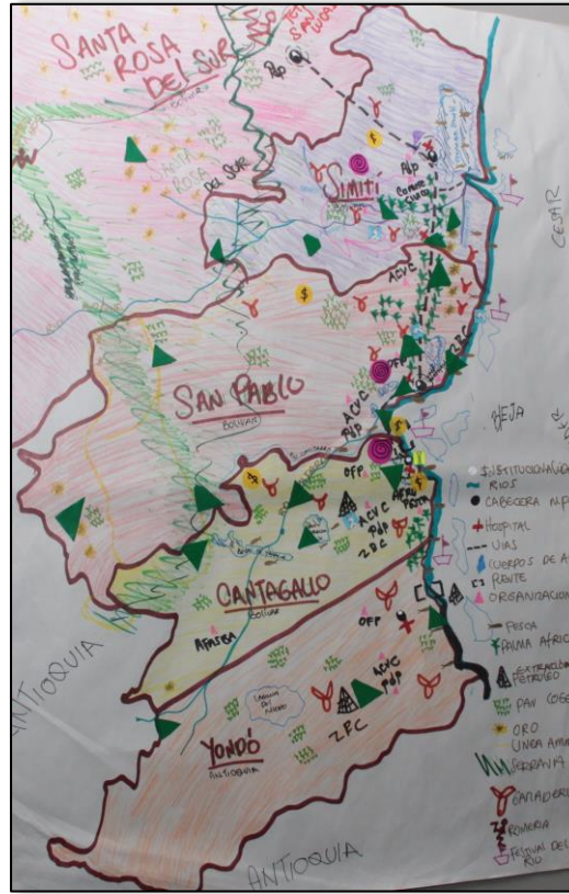
Figura 2. Construcción de cartografías sociales por subregiones durante la segunda sesión de formación (Bogotá, Julio, 2019).

Basados en la cartografía del territorio que describió los cinco municipios definidos para la subregión Magdalena Medio (Yondó, Cantagallo, San Pablo, Santa Rosa del Sur y Simití), el equipo participante analizó la información registrada y dio paso a la descripción de los conflictos evidenciados en cada municipio. La información del municipio de Yondó fue de carácter general, ya que entre los participantes no había representación de líderes o lideresas de este municipio.