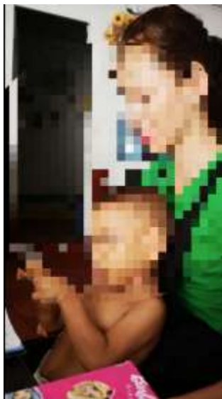
Anexo 3 Fotografía