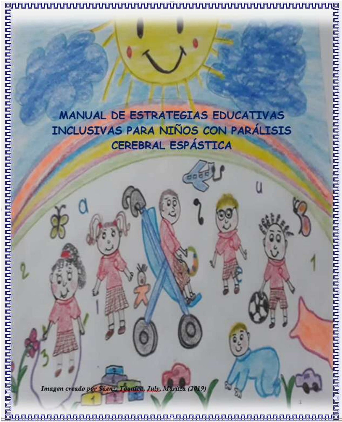
Imagen creado por Sáenz, Toquica, July, Maritza (2019)