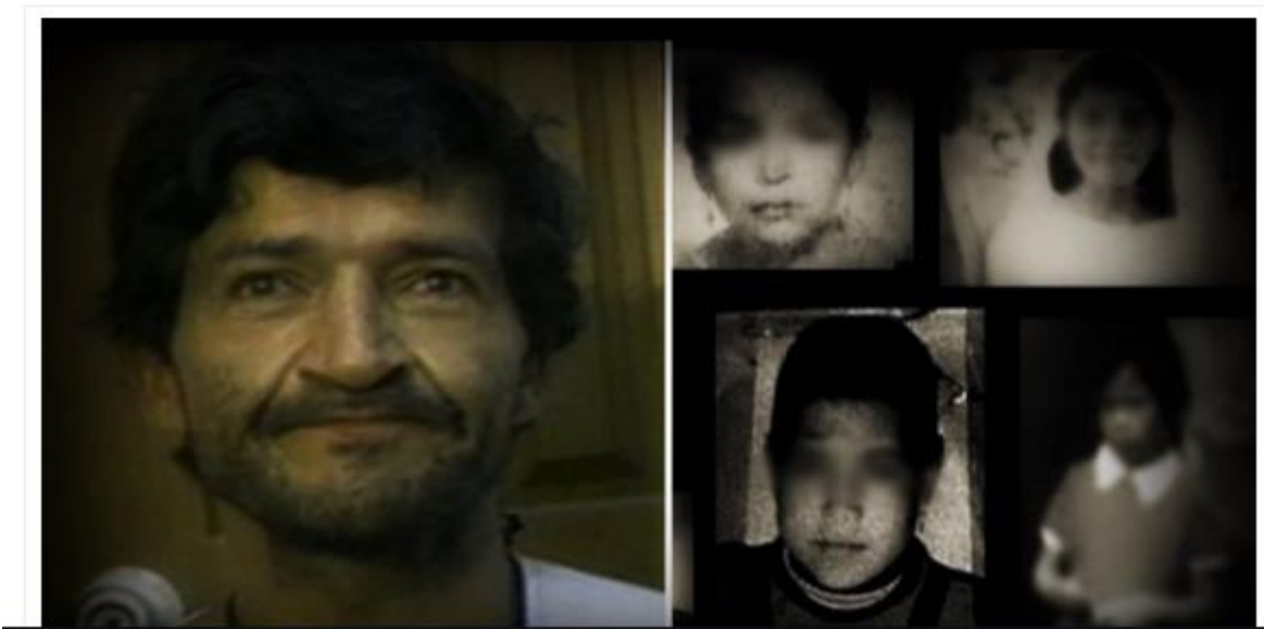
2 Pabón G. (2017). Los 5 homicidas colombianos que fueron iguales o peores que Garavito [imagen]. Recuperada de https://canal1.com.co/entretenimiento/especial-halloween-homicidas-colombianos-garavito/

En un documental de Biography Channel, Pedro Alonso López explicó que buscaba niñas que tuvieran "inocencia y belleza".