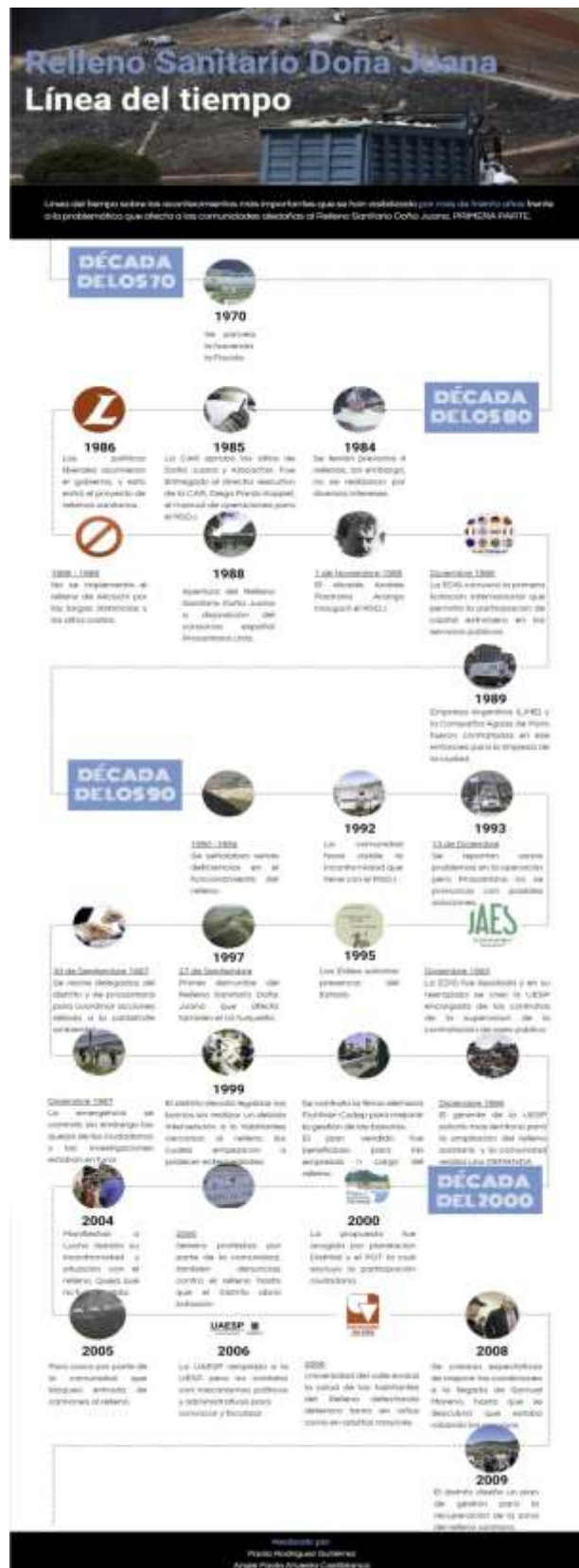
Anexo 1: Historia del relleno sanitario Doña Juana 1.

Vista online: https://co.pinterest.com/angieatuesta20/relleno-do%C3%B1a-juana/