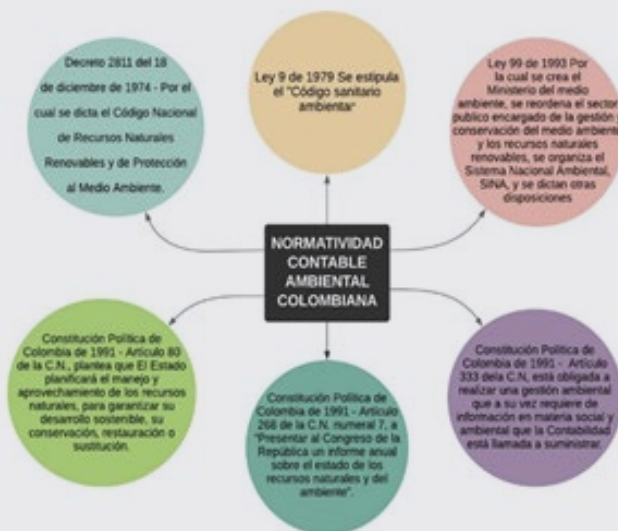
GRÁFICO 2: NORMATIVIDAD CONTABILIDAD AMBIENTAL COLOMBIANA.