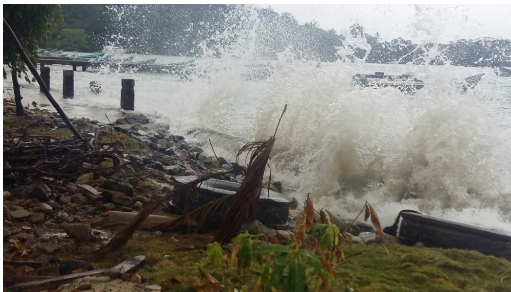
Figura 5. Daños causados por el invierno.

La ubicación del Hotel el Refugio hace que este factor sea de vital importancia en su ocupación, para llegar al hotel se debe atravesar el río Samaná, que en temporada de lluvias tiene fuertes corrientes de agua y sea difícil el acceso. Adicional a esto un clima agresivo podría traer daños al establecimiento.