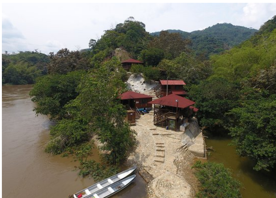
Figura 1. Ingreso al hotel.

Su ubicación estratégica le permite asegurar el servicio en lancha para el transporte a la zona y la actividad de pesca, siendo un lugar apetecido por los pescadores de la región y atractivo para los turistas internacionales por ser un lugar rodeado de naturaleza.