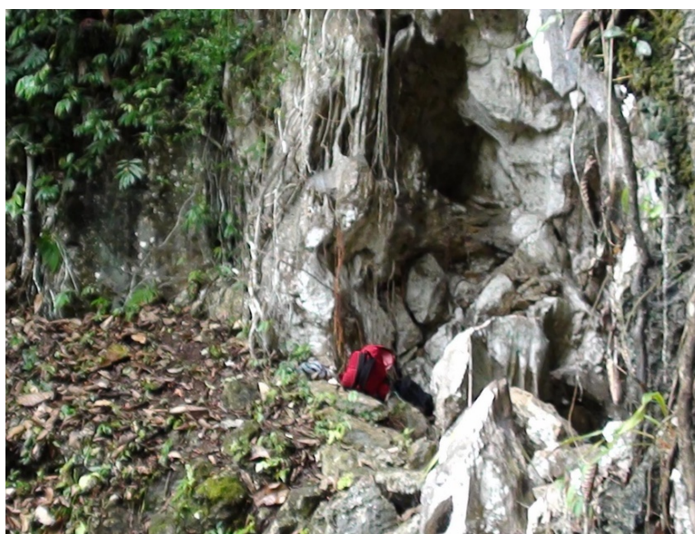
Figura 3. Cavernas del Nus.

Las visitas a las cavernas y los recorridos ecológicos hacen de este lugar, un paradero especial para los amantes de la naturaleza es un pequeño paraíso rodeado de naturaleza, cascadas, las cavernas del Nus y el río Samaná.