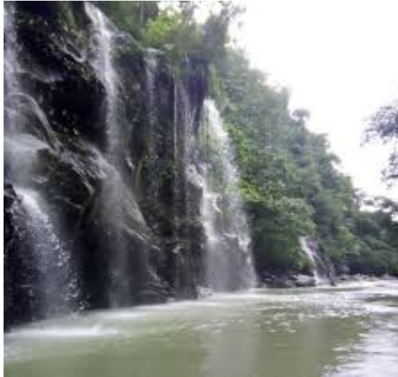
Figura 4. Cascadas.

El hotel es una herencia del padre de los propietarios, el cual en su tiempo de vida lo usaba como lugar de descanso personal, al morir sus dos hijos tomaron posesión y lo adaptaron como sitio de recreo.